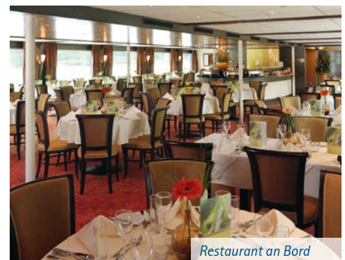
Restaurant an Bord