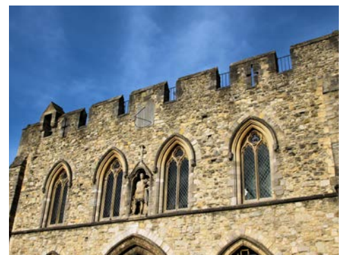
Bargate in Southampton

Von diesem historischen Hafen aus startete einst die „Mayflower“ zu ihrer legendären Fahrt nach Nordamerika, woran auch das Mayflower Memorial