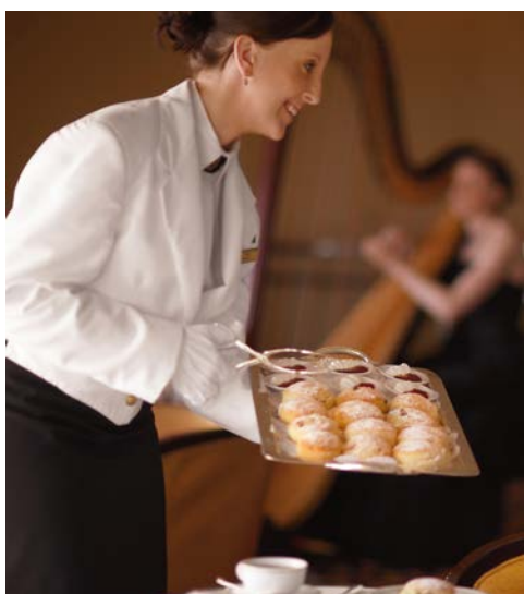
Herzliche Gastlichkeit und ...

erinnert. Hier liefen auch im „Goldenen Zeitalter“ alle großen Cunard Liner aus. Nutzen Sie die Gelegenheit, mit deutschsprachigen Reiseleitern auf Entdeckungstour zu gehen. Wahrzeichen der Stadt ist übrigens das Bargate, ein von den Normannen erbautes Stadttor.