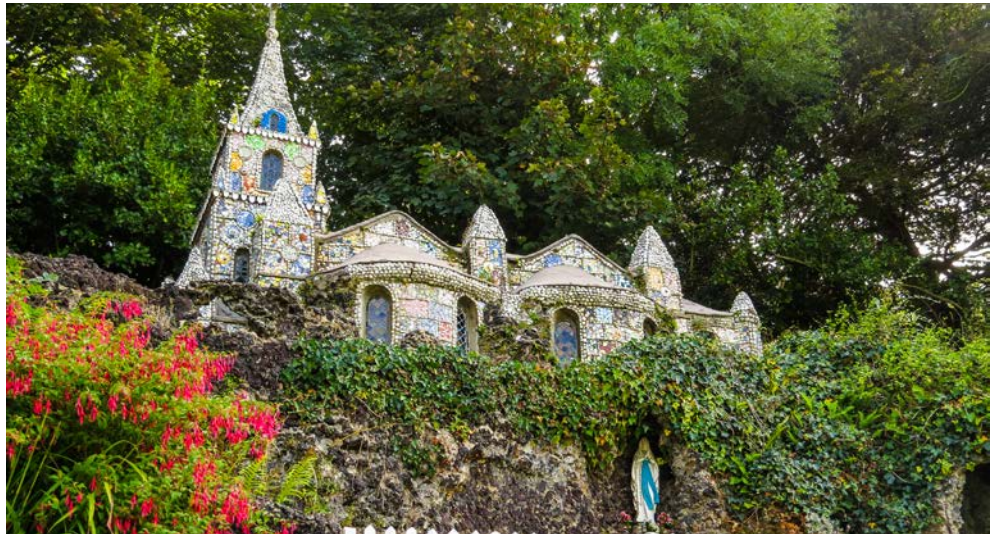
Bezaubernd – Little Chapel auf Guernsey

In der Regel erfolgt die Ankunft in einem Hafen morgens zwischen 6 und 10 Uhr. Das Ablegen erfolgt normalerweise am selben Tag zwischen 16 und 20 Uhr. Ein- und Auslaufzeiten in Hamburg sind tideabhängig.