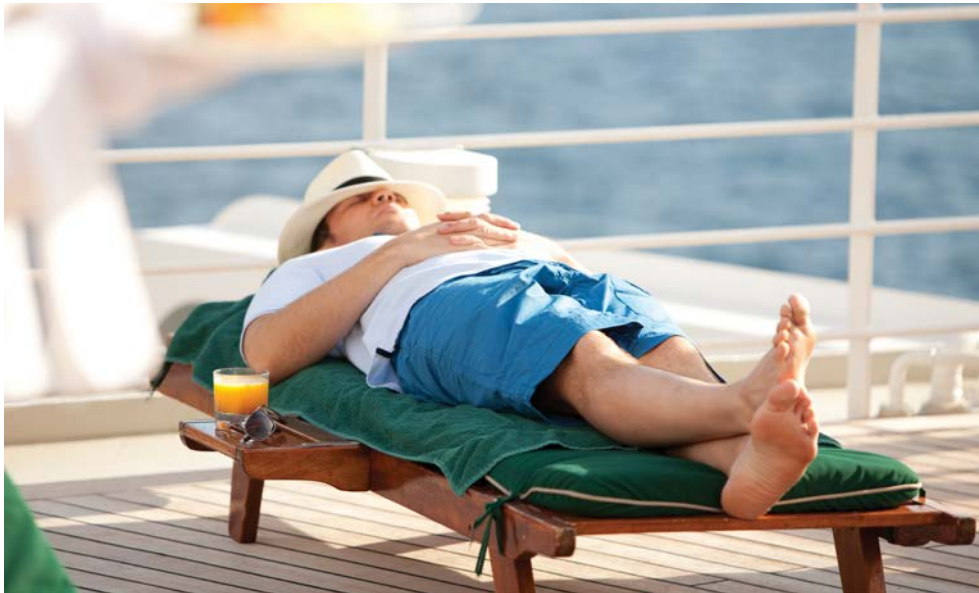
Lassen Sie es sich gut gehen