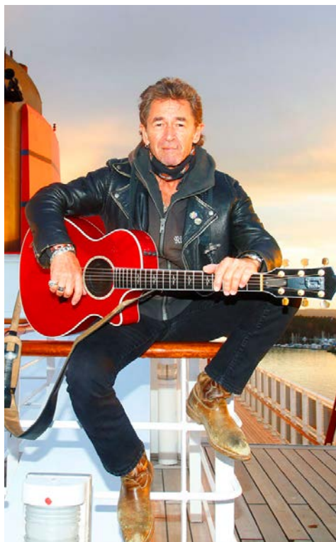
Freuen Sie sich auf einen großartigen Musiker

Auf 13 Decks warten mehr als 100 große und kleinere Attraktionen darauf, jeden Tag an Bord zum schönsten Ihres Lebens werden zu lassen. Inspiration finden Sie zum Beispiel bei einem Rundgang durch