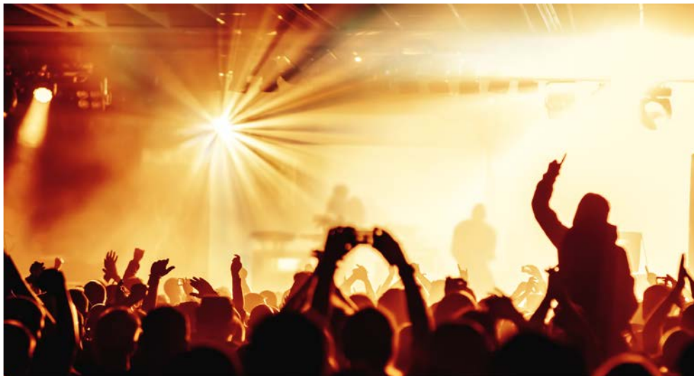
Rocken Sie das Schiff!