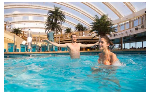
365 Tage Sonne, Sommer, Baden ... im Beach Club an Bord

5. Tag, Sonntag, 3. Dezember 2017 Erholung auf See 365 Tage Sommer – und jeden Tag ein neuer Urlaub! AIDAperla vereint viele Urlaube in einem. Sie müssen sich nicht festlegen, was Sie am liebsten mögen. Entspannung unter Palmen oder Action im Four Elements, Strandparty im Beach Club – völlig wetterunabhängig – oder exklusives Variété im Nachtclub, französische Küche oder Grillhaxe, Wellness auf 5-Sterne-Niveau oder Champagner unterm Sternenhimmel – auf AIDAperla erleben Sie all das und vieles mehr auf einer Reise. Genießen Sie diesen Tag!