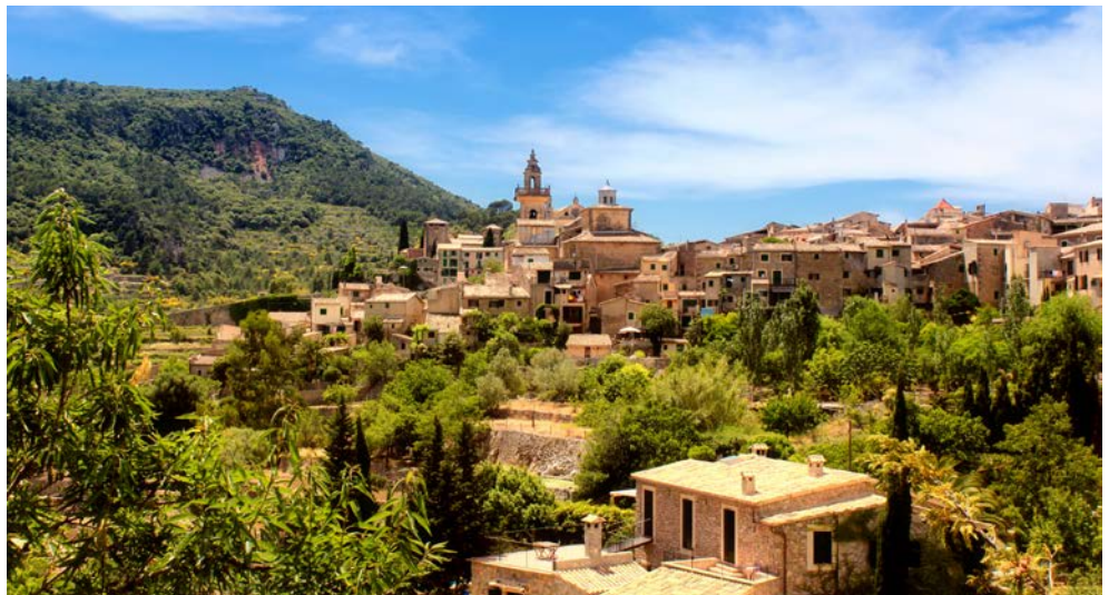
Zauberhaft – Blick über Valldemossa auf Mallorca