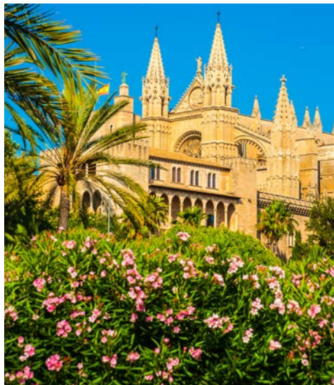
Kathedrale La Seu in Palma de Mallorca

2. Tag, Donnerstag, 30. November und 3. Tag, Freitag, 1. Dezember 2017 Aufenthalt auf Mallorca – Insselfahrt „Bergwelt Mallorcas“ (falls gebucht) Freuen Sie sich auf zwei herrliche Tage auf der Lieblingsinsel der Deutschen. Mallorca ist so viel mehr als Ballermann und Partymeile. Die Vielfalt dieser Balearen Schönheit bringt Ihnen ein zusätzlich buchbarer, ganztägiger Ausflug nahe. Dabei sehen Sie die herrlichen Gärten von Alfabia und Fornalutx, ein Dorf, das schon mehrfach zum schönsten Dorf Spaniens gewählt wurde. Sie erkunden Soller, ein kleines, beschauliches Städtchen im Herzen des Tramuntana Gebirges. Die Rückfahrt zum Hotel erfolgt über den Künstlerort Deyà sowie Valldemossa. Berühmt wurde das Dorf auch durch den Komponisten Frédéric Chopin und seine Geliebte, die Schriftstellerin George Sand, die hier drei Monate zusammen verbrachten.