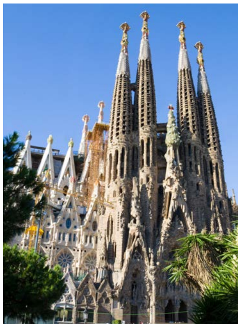
Fantasievoll – die Architektur von Antoni Gaudí

Von der romantischen Atmosphäre des alten Hafens über die Kirche Notre-Dame de la Garde bis zu der faszinierenden Küstenlandschaft der Calanques ... Marseille ist wie ein bunter Teller mit verschiedensten leckeren Zutaten. Dies trifft auch auf die regionale Spezialität zu: Bouillabaisse wird aus mindestens sieben verschiedenen Fischarten zubereitet. Bon appétit!