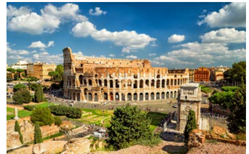
Unverkennbar – Colosseum in Rom

4. Tag, Samstag, 2. Dezember 2017 Einschiffung in Palma de Mallorca/ Spanien Genießen Sie entspannte Stunden im Hotel, bevor Sie zum Hafen von Palma gebracht werden. Hier erwartet Sie AIDAperla bereits zur Einschiffung.