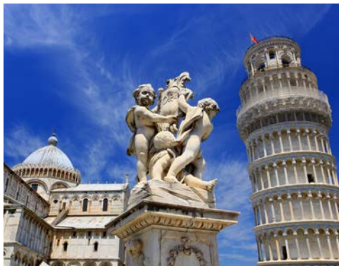
Lassen Sie sich einen Ausflug nach Pisa nicht entgehen

Livorno ist der ideale Ausgangspunkt, um die Kulturschätze und Landschaft der Toskana zu entdecken: die Kunstwerke der Renaissance in Florenz, den schiefen Turm von Pisa oder die „Stadt der Türme“ San Gimignano. Doch Kunstgenuss ist nicht alles – runden Sie Ihren Besuch mit einer Weinprobe auf einem Gut in der berühmten Chianti-Region ab und lassen Sie sich in die Geheimnisse der edlen Tropfen einweihen.