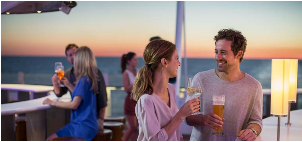
Genießen Sie das Bordleben