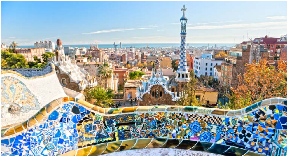
Gute Aussichten vom Park Güell aus auf Barcelona

schön, dass man es unbedingt wiedersehen will. Um auf Nummer sicher zu gehen, empfehlen wir Ihnen einen Besuch des Trevi-Brunnens. Wenden Sie ihm den Rücken zu und werfen Sie mit der linken Hand eine Münze über die rechte Schulter ins Becken. Dann, so der Volksglaube, werden Sie auf jeden Fall in die Ewige Stadt zurückkehren. Falls Sie Single sind, können Sie auch zwei Münzen werfen – und sich daraufhin in einen Römer oder eine Römerin verlieben.