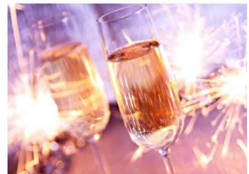
Alle Gute für das neue Jahr!

Die Winzerstadt Rüdesheim gehört zum UNESCO-Weltkulturerbe und ist berühmt für die schönen Fachwerkhäuser und die vielen urigen Weinlokale.