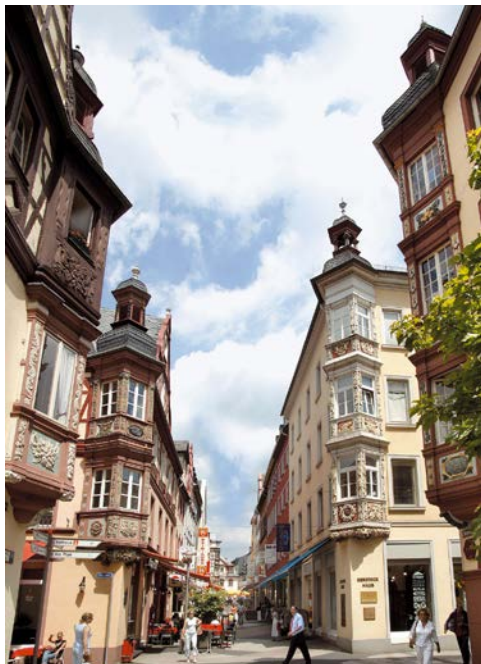
Vier-Türme Altstadt, Koblenz