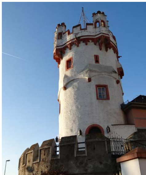
Der Adlerturm in Rüdesheim

Noch vor dem Frühstück legt Ihr Schiff ab und es liegt ein Tag voller Entspannung und winterlicher Flussromantik vor Ihnen. Nehmen Sie Platz im Salon und genießen Sie die vorbei ziehende Landschaft mit den Schönheiten des Rheins. Gegen 15 Uhr passieren Sie den sagenumwobenen Loreley-Felsen. Am Abend Ankunft in Rüdesheim.