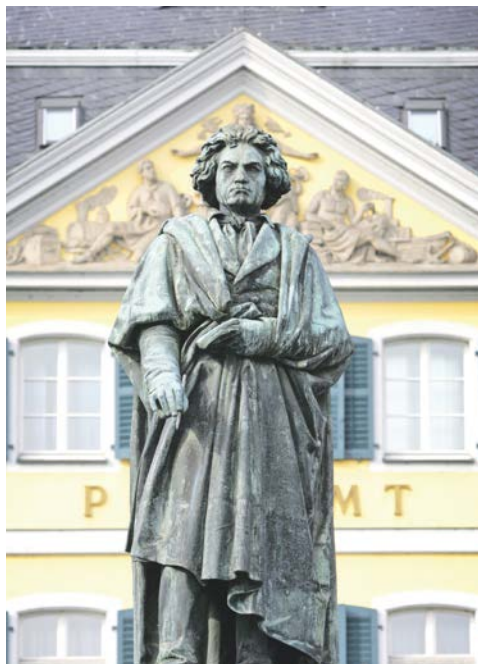
Beethoven-Denkmal in Bonn

Facetten dieser Stadt. Erleben Sie die prachtvollen Fassaden der Gründerzeithäuser, die Museumsmeile, Bad Godesberg mit seinem Villenviertel sowie das Poppeldorfer Schloss und das ehemalige Regierungsviertel. Genießen Sie den letzten Abend an Bord, und auch der Musiker freut sich darauf, Ihnen einen unterhaltsamen Abend zu bereiten.