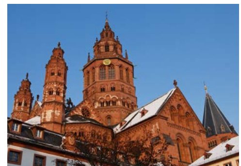
Der Mainzer Dom

Auf der Fahrt von Mainz nach Koblenz passieren Sie gegen 11.30 Uhr nochmals die Loreley. Am Zusammenfluss von Rhein und Mosel, am weltweit bekannten Deutschen Eck, liegt Koblenz, eine der schönsten