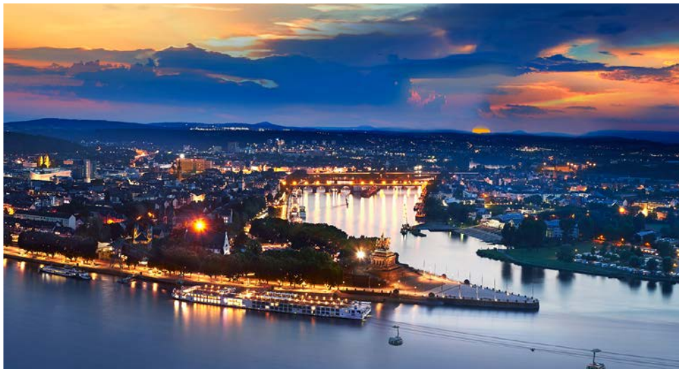
Das Deutsche Eck in Koblenz