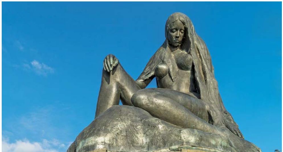
Die vielbesungene Loreley

Programmänderungen bedingt durch Wartezeiten an Schleusen, Wasserstände, Gezeiten und anderer navigatorischer Umstände bleiben vorbehalten.