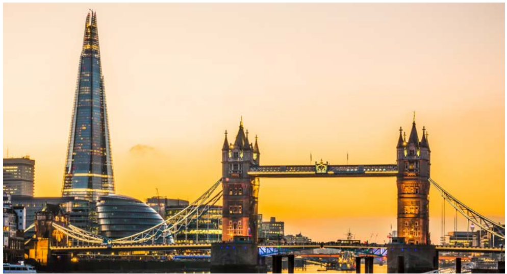
London erwartet Sie zu einem erlebnisreichen Aufenthalt

*Das Schiff verlässt Amsterdam am 01.01. voraussichtlich um 1:00Uhr