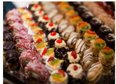
Freuen Sie sich auf einen stilvollen Silvester-Abend ...

Obwohl keine direkte Verbindung mehr zwischen Brügge und der Nordsee besteht, hat sich der Ort durch den Stadtteil Zeebrügge die Ausdehnung bis zum Meer bewahrt. Auch Brügge selbst lädt zu einem Besuch: Durch enge Gassen erreicht man den Marktplatz mit der Heilig-Blut-Kapelle. Ein weiterer Höhepunkt ist das Rathaus und das St. Jans Hospital. Sie erleben eine malerische Stadt, deren Vergangenheit noch in den Grachten und Straßen lebendig scheint.