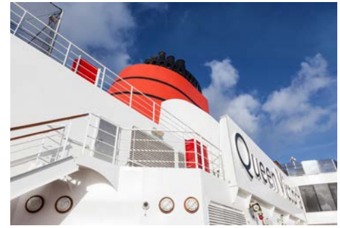
Willkommen an Bord

Kleidung: Die Gäste an Bord kleiden sich tagsüber sportlich-leger, am Abend ist der Dresscode entweder formell oder informell. Die genaue Beschreibung der gewünschten Kleidung folgt mit Ihren finalen Reiseunterlagen. Das Buffet-Restaurant bietet auch am Abend eine Alternative für legere Kleidung.