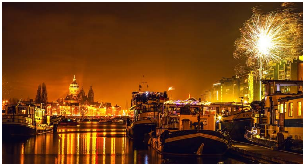
Feuerwerk über Amsterdam