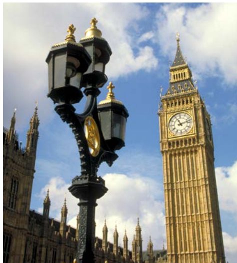
Big Ben – typisch London

Anreise nach Calais – Dover – London/England Busfahrt von Berlin nach Calais. Von hier aus setzen Sie mit der Fähre nach England über. Nach der Ankunft in Dover Busfahrt zu Ihrem Hotel in London. Am Abend laden wir Sie herzlich zu einem gemeinsamen Dinner im Hotelrestaurant ein.