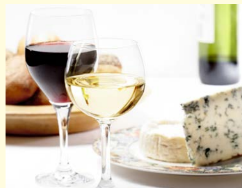
Typisch Frankreich ...