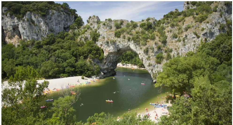
Fantastische Ausflugsmöglichkeiten erwarten Sie, z.B. in die Schluchten der Ardèche