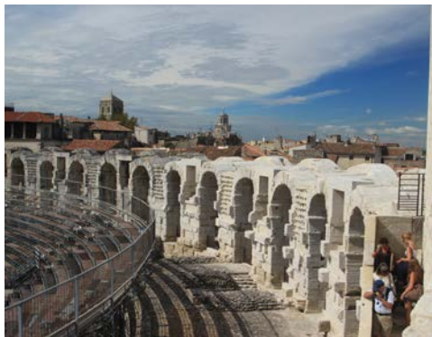
Amphitheater in Arles

Sie fahren dann weiter nach les Saintes-Maries-de-la-Mer, eine kleine Stadt auf der Mittelmeerküste. Dort haben Sie die Gelegenheit alleine das Gebiet zu entdecken bevor Sie nach Arles zurückkehren. Im Sommer belebt sich der Badeort von Saintes-Maries-de-la-Mer mit seinen Stränden, seinen Kaffees, seinen kleinen Läden und seinen Restaurants, die Spezialitäten der Camargue vorschlagen, wie die Gardiane, geschmortes Stierfleisch, oder noch die Telline, kleine Muschel.