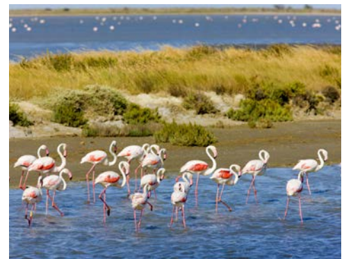
Flamingos in der Camargue

Nicht entgehen lassen sollten Sie sich einen Ausflug in die Schluchten der Ardèche. Über Jahrtausende wurden Kalksteinfelsen von dem türkisgrünen 120 km langen Fluss Ardèche ausgehöhlt. Dieses natürliche Phänomen hat eine fantastische Landschaft geschaffen, die zu den schönsten in Südfrankreich gehört. Bevor Sie den beeindruckenden natürlichen Kalksteinbogen Pont d'Arc erreichen, der den Fluss Ardèche überspannt, besuchen Sie das Lavendelmuseum von St Remèze, in dem Sie viel über die Herstellung des Lavendelparfüms lernen werden. Mehrere kurze Stopps geben Ihnen die Möglichkeit, Fotos aus verschiedenen Aussichtspunkten zu machen. Durch eine schmale Seitenstraße erreichen Sie endlich einen Beobachtungsstand ganz nahe bei der Grotte La Madeleine. Von dort aus können Sie die Ansicht über den sogenannten Dom beobachten, eine beeindruckende Steinformation in den Schluchten der Ardèche.