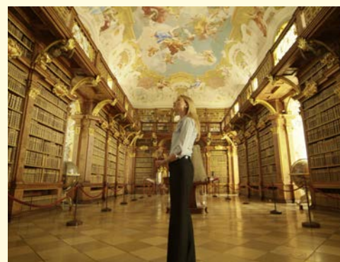
Die Bibliothek im Stift Melk ist beeindruckend

• Jubiläums-Bonus in Höhe von € 70,- p.P. pro Reise bereits inklusive • Ohne Einzelkabinen-Zuschlag bei den Reisen 27.09.17 und 18.10.17!