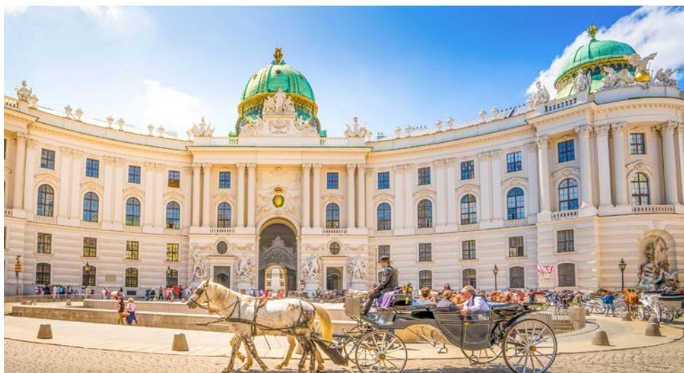
Die berühmte Wiener Hofburg