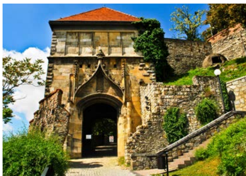
Besuchen Sie auch die Pressburg in Bratislava

Der breite Strom der Donau zieht sich wie ein silberner Faden durch die Stadt und teilt das bergige Buda und das flache Pest. Kaiserin Sisi z.B. verbrachte den Sommer am liebsten auf Schloss Grassalkovich im nördlich gelegenen Gödöllo. Auch Sie werden dem Reiz dieses schneeweißen Barockschlosses erliegen. Auf der Margareteninsel entspannen sich die Buda- pester vom Alltag. Ein Bummel durch das Burgviertel führt Sie zur Matthiaskirche, die zum UNESCO- Welterbe gehört. Lassen Sie sich einfach treiben und nutzen Sie die Zeit für eigene oder organisierte Erkundungen.