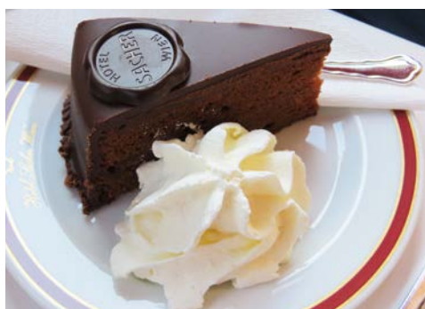
Wie wäre es mit einer typischen Sachertorte?

Am frühen Nachmittag erreichen Sie Wien. „Wien ist anders“. Mit dieser Feststellung wirbt die Stadt seit Jahren – und es liegt viel Wahres in diesem Statement. Denn in Wien treffen Welten aufeinander: Tradition und Moderne, alt und neu, mittelalterliche Gässchen und moderne Passagen – all diese Gegensätze verleihen Wien seinen besonderen Charme. Ihnen stehen vielfältige und fantastische Ausflugsmöglichkeiten zur Verfügung. Gut, dass Sie über Nacht in dieser fantastischen Metropole bleiben, so haben Sie ausreichend Zeit für Erkundungen!