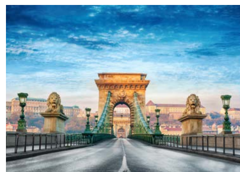
Die imposante Kettenbrücke in Budapest

Schon von Weitem grüßt die Basilika von Esztergom jeden Besucher. Vor Ihnen liegt schließlich die größte klassizistische Basilika Ungarns mit 118 Meter Länge und 48 Meter Breite. Ihre riesige grüne Kuppel ragt weit über die Stadt hinaus und raubt einem schlichtweg den Atem! Budapest ist Liebe auf den ersten Blick und gilt als eine der am schönsten gelegenen Städte der Welt. Nachts zeigt sich die „Königin der Donau“ von ihrer funkelnden Seite. Schon am Tag eine Augenweide, sind ihre in der Dunkelheit angestrahelten Sehenswürdigkeiten an Schönheit kaum zu überbieten. Bei einem Blick vom Burgberg aus liegen Ihnen die Donau und der Stadtteil Pest als glitzernder Teppich zu Füßen.