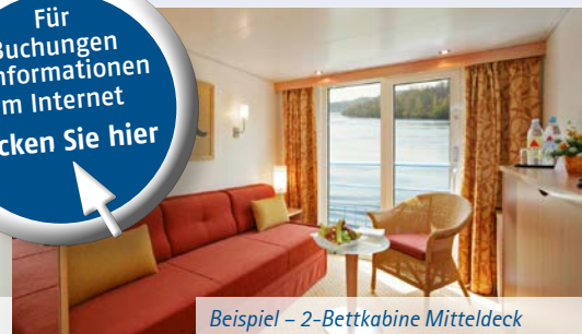
Beispiel – 2-Bettkabine Mitteldeck