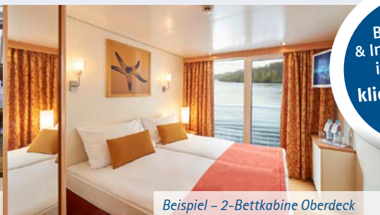
Beispiel – 2-Bettkabine Oberdeck