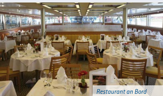
Restaurant an Bord