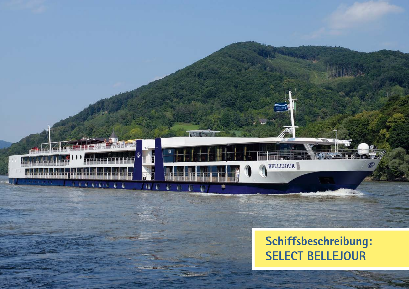
Schiffsbeschreibung: SELECT BELLEJOUR