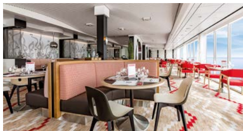
Genießen das ansprechende Ambiente an Bord.

Wohnlich. Stilvoll. Individuell. Kunstwerke für Ihre Kabine: In Zusammenarbeit mit International Corporate Art wurden in Oslo die Kunstwerke für die Kabinen der Mein Schiff 5 ausgesucht. Über 80 % der 1.267 Kabinen sind mit großzügigen Balkonen oder Veranden ausgestattet und bieten entspannte