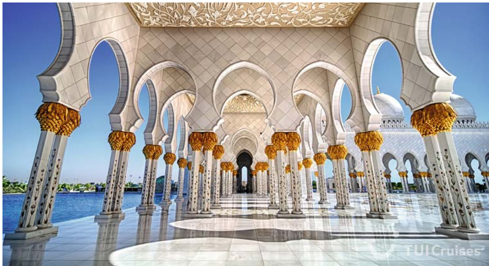
Das müssen Sie unbedingt gesehen haben – die Sheikh Zayed Moschee

prächtige Moscheen und Paläste, das azurblaue Meer und Sandstrände – hier kann man schon mal ins Schwärmen kommen.