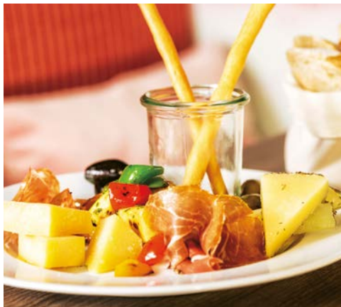
Premium Alles Inklusive

Sicher haben Sie längst Ihren Lieblingsplatz an Bord gefunden. Nutzen Sie die vielen Freizeitangebote, Pools sowie das Premium Alles Inklusive Konzept, bevor Sie am nächsten Morgen Abu Dhabi erreichen.