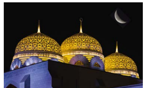
Moschee im Oman

Atemberaubende Fjordlandschaften sind das Hauptmerkmal dieser rauen Landschaft rund um den Hauptort Khasab an der Straße von Hormus. Machen Sie eine Jeep-tour durch diese unvergleichliche Natur. Besuchen Sie das geschichtsträchtige Fort Khasab aus dem 16. Jahrhundert und genießen Sie den Blick auf die vorgelagerte Bucht. Oder entdecken Sie die Gegend vom Wasser aus: Bei einer Dhau-Fahrt durch die Fjorde sollten Sie die Augen offen halten. Mit Glück begegnen Ihnen ein paar Delfine.