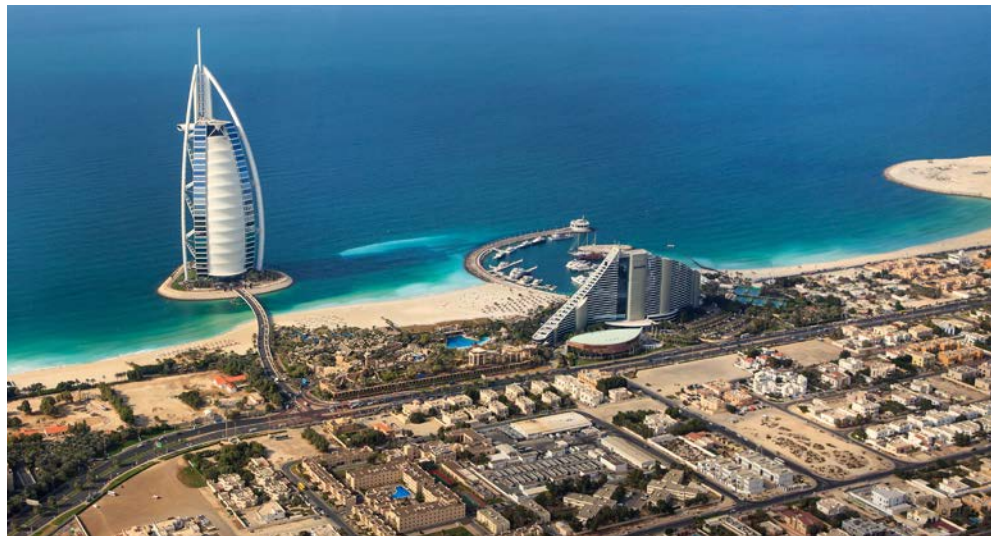
Blick auf Dubai