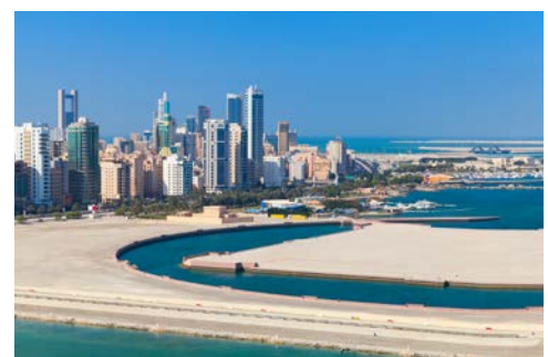
Blick auf Manama

„Zwei Meere“ bedeutet das arabische Wort „Bahrain“, und das Emirat macht seinem Namen alle Ehre: Es wird vom Meerwasser umspült und gleichzeitig mit reichlich süßem Grundwasser versorgt. Das Emirat besteht aus insgesamt 33 Inseln, deren Hauptstadt Manama ihre Besucher mit Vielfalt verwöhnt: Aufregende Nachtclubs, Luxusresorts und vorzügliche Restaurants warten auf Entdeckung, und im Gegensatz zu den Nachbarländern können Sie hier auch einen Wein zum Essen bestellen. Erfahren Sie Spannendes aus 5.000 Jahren Geschichte: von der Steinzeit über die Perlentaucherei bis hin zum Ölboom im Nationalmuseum – und kommen Sie danach im Hier und Jetzt an, bei einem Besuch der bekannten 5,4 Kilometer langen Formel-1-Strecke. Oder begeben Sie sich auf die Spuren des Öls: Bahains erste Ölquelle sprudelte das erste Mal im Jahr 1923 und bescherte der Region unermesslichen Reichtum. Und spätestens beim Besuch einer Kamelfarm haben Sie schon die wichtigsten Facetten arabischen Lebensgefühls kennengelernt.