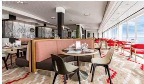
Genießen das ansprechende Ambiente an Bord.

Beim gastronomischen Angebot erleben Sie Individualität und exzellenten Service. Keine festen Essenszeiten – die Speisen der meisten Restaurants sind inklusive.