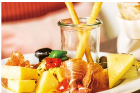
Premium Alles Inklusive

Sicher haben Sie längst Ihren Lieblingsplatz an Bord gefunden. Nutzen Sie die vielen Freizeitangebote, Pools sowie das Premium Alles Inklusive Konzept und erreichen Sie mit einem Drink in der Hand Abu Dhabi.