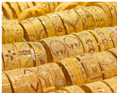
In den Souks geraten Sie in den Goldrausch

Vor allem die Skyline Dubais sollten Sie aufmerksam betrachten – sie könnte in ein paar Jahren schon wieder ganz anders aussehen. Denn die Stadt wächst unaufhaltsam und trumpft mit beeindruckenden Bauprojekten auf. Erst 2010 eröffnete in Dubai das höchste Gebäude der Welt: 828 Meter misst der Burj Khalifa. Dem schnellen Wachstum will Dubai mit künstlich angelegten Inseln begegnen: „The Palms“ werden heute bereits als achties Weltwunder gepriesen. Lassen Sie sich von dem märchenhaften Aufstieg der Metropole verzaubern – sie wird Sie faszinieren. Wenn Sie Lust haben, können Sie heute an einem Ausflug Zum Burj Al Arab teilnehmen. Bestaunen Sie das Hotel, das Dubai zu Weltruhm verhalf und zu einem Symbol für Reichtum und Luxus geworden ist: das 321 m hohe Burj Al Arab, das wohl edelste Hotel der Welt.