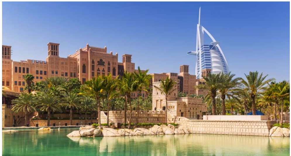
Blick auf den Souk Madinat und den Burj Al Arab