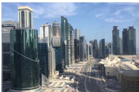
Doha in Katar