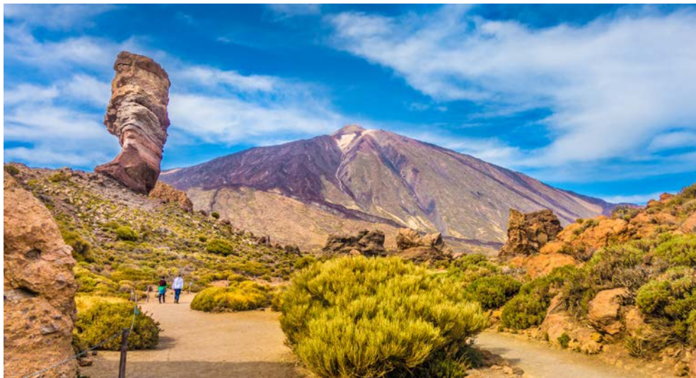
Teneriffa, der Pico del Teide

7. Tag, Dienstag, 31. Oktober und 8. Tag, Mittwoch, 1. November 2017 Funchal/Madeira