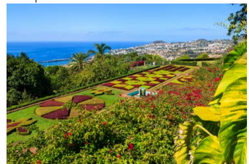
Aussicht vom Botanischen Garten Richtung in Funchal

Ein riesiger LED-Screen, ein weitläufiges Sonnendeck mit Pool und ein großer Sportaußenbereich, ein eigenes Brauhaus, 7 Restaurants, Wellness im Body & Soul Spa Bereich ... Willkommen an Bord!