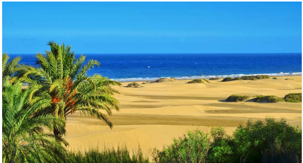
Die Dünen von Maspalomas