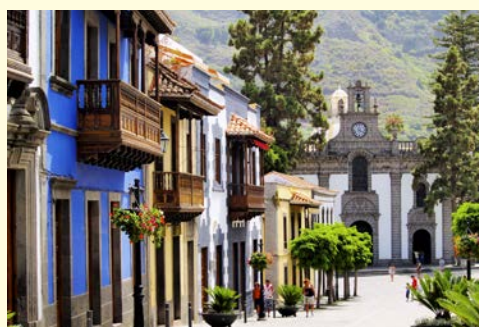
Besuchen Sie Teror auf Gran Canaria