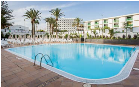
Außenpool Ihres Hotels

In der Ferienregion von Playa des Inglés erwartet Sie das Hotel Labranda Marieta – nur für Erwachsene. Freuen Sie sich auf eine Dachterrasse mit Panoramablick zum Entspannen und eine Bar am beheizbaren Außenpool. Im Buffetrestaurant speisen Sie morgens und abends im Rahmen der Halbpension. Die Unterkunft bietet kostenloses WLAN und ein hoteleigenes Fitnessstudio. Die modern eingerichteten, hellen Zimmern verfügen über einen Flachbild-Sat-TV, einen Schreibtisch und ein eigenes Badezimmer mit Dusche und Haartrockner. In nur wenigen Gehminuten erreichen Sie verschiedene Geschäfte, Bars und Restaurants.