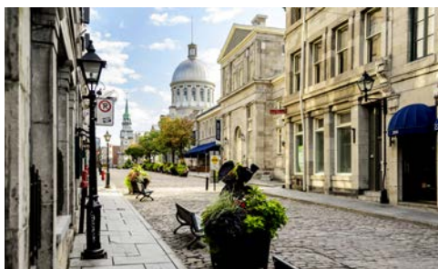
Altstadt von Montreal

Am Morgen Ausschiffung und anschließend Stadtrundfahrt durch Montreal. In der aufregenden Mischung aus französischer Leichtigkeit und amerikanischer Betriebsamkeit ist die junge Geschichte Kanadas allgegenwärtig. Die Altstadt, das Geschäftsviertel und die Universität werden Sie sicher faszinieren. Ihre Rundreise beginnt mit der Fahrt nach