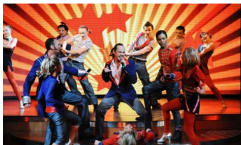
It's showtime – im Theatrium an Bord

Und übrigens: mit klassisch-legerer Kleidung liegen Sie an Bord immer richtig.