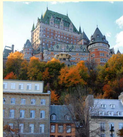
Chateau Frontenac in Quebec

Die Zeit bis zum Flughafentransfer steht Ihnen zur freien Verfügung. Dann Rückflug nach Deutschland. Ankunft am 15. Tag am gebuchten Flughafen.