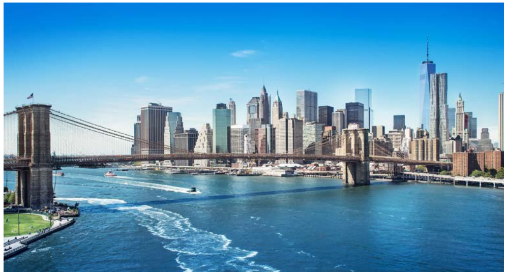
Grandiose Skyline – fantastische Stadt – New York