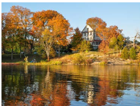
Impressionen bei den Thousand Islands

Ottawa. Bei einer Stadtrundfahrt lernen Sie die sympathische Stadt mit ihrem imposanten Parlamentsgebäude kennen. Übernachtung in Ottawa.