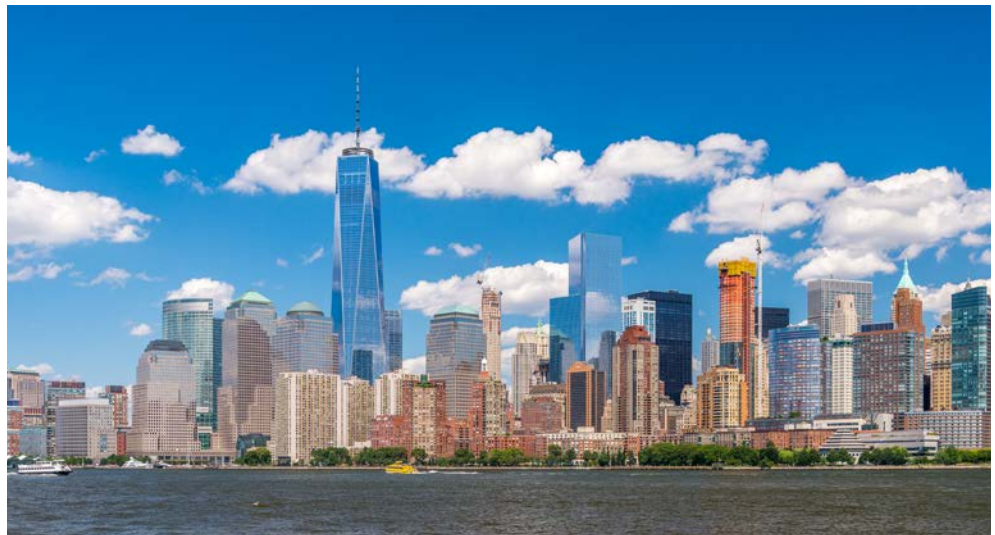
Grandiose Skyline – fantastische Stadt – New York