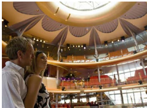
Das Theatrium – das Herz des Schiffes

Sportbegeisterte werden auf Deck 11 fündig, hier steht der Body & Soul Sport Bereich bereit, mit Golfschlagplätzen, Volleyballfeld und Joggingparcours. Das Markt Restaurant bietet Speisen wie frisch vom Markt, das Bella Vista Restaurant bringt mit Pizza und Pasta italienisches Flair auf den Tisch. Das Weite Welt Restaurant lädt zu einer kulinarischen Reise durch die Küchen dieser Erde. Im Gourmet Restaurant Rossini, im Buffalo Steak House und in der Sushi Bar werden ebenfalls höchste Qualitätsansprüche erfüllt. Einfach fantastisch ist das Raumkonzept des Theatriums, das pulsierende Herz des Schiffes. Hier verschmelzen Theater, Bars und Marktplatz zu einem einzigartigen Raumerlebnis auf drei Decks.