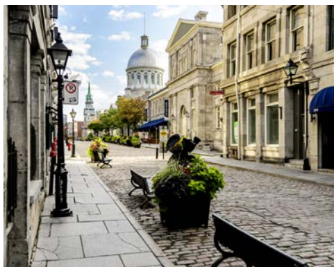
Altstadt von Montreal

Willkommen in der „Stadt der hundert Kirchtürme“. Der Schriftsteller Mark Twain meinte angesichts der Vielzahl sakraler Bauten, man könne hier „keinen Ziegel werfen, ohne ein Kirchenfenster zu zerbrechen“. Dies sollte man jedoch unbedingt unterlassen – besonders wenn man sich in der Nähe der Basilika Notre-Dame befindet, die zu den schönsten Kirchen Nordamerikas zählt. Sie übernachten an Bord von AIDAdiva.