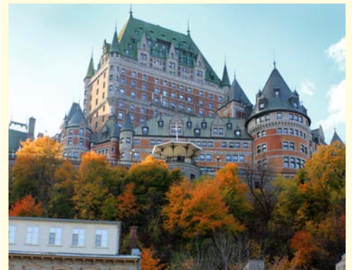
Chateau Frontenac in Quebec