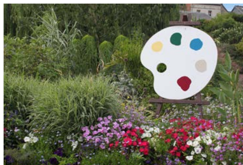
Spuren großer Künstler im Land der Impressionisten

ersten Dinner. Nachdem Sie sich gestärkt haben, sollten Sie es nicht versäumen, einen Bummel durch den romantisch angestrahlten Hafen von Honfleur zu unternehmen, um die verträumte Atmosphäre zu genießen. Nehmen Sie Platz in einem der zahllosen kleinen Straßencafés und beobachten Sie das Treiben in den kleinen, uralten Gässchen. Ihr Schiff bleibt über Nacht in Honfleur.