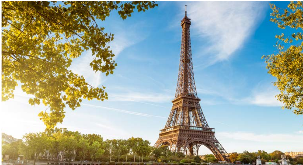
Der Eiffelturm ist ein echter „Evergreen“ unter den Sehenswürdigkeiten

Vorbei an Pont-de-l'Arche erreicht Ihr Schiff hinter der Schleuse von Amfreville den gezeitenunabhängigen Teil der Seine. Kurvenreich, gemütlich und nicht mehr den Gesetzen von Ebbe und Flut unterworfen, führt jetzt die Fahrt durch herrliche Landschaften, vorbei an Burgen und Abteien, die so typisch für die geschichtsträchtige Normandie sind. Ein Höhepunkt dieses Fahrtabschnitts ist zweifellos ein Blick auf das seltsam verwüstete elfenbeinfarbige Château Gaillard. Der Sage nach ließ Richard Löwenherz diese massive Festung in nur einem Jahr über dem Fluss erbauen. Weiter flussaufwärts bei Les Andelys erwartet Sie ein anderes Bild. An den Uferhängen scheinen die hellen Kalkklippen durch das Grün der Wiesen. Dicht am Fluss, unterhalb der Klippen stehen wie abgebrochene Zähne wirkende kleine Fachwerkhäuser. Während des heutigen Gala-Dinners erreichen Sie Vernon.