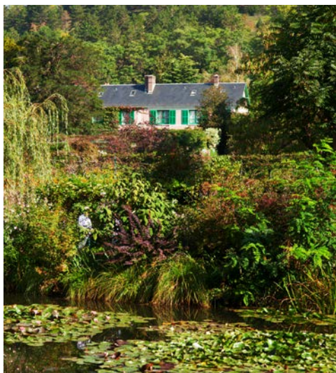
Im Garten von Claude Monet

Mit dem Bus fahren Sie nach dem Frühstück in den kleinen Ort Giverny. Hier befindet sich der wohl berühmteste Seerosenteich der Welt: Giverny war der Wohnort des Malers Claude Monet, der mit seinen Bildern diese Region am Rande der Normandie weltbekannt machte. Ihnen bleibt Zeit, das farbenprächtige Innere des Hauses, in dem sich Monets Sammlung japanischer Drucke und Keramik befindet, zu