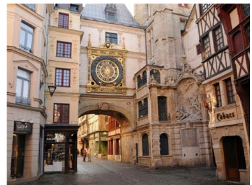
Das historische Rouen wird Sie begeistern

Direkt nach dem Frühstück erwartet Sie ein Gästeführer zu einem Rundgang durch die sehenswerte Altstadt. Die Hauptstadt der östlichen Normandie ist ein wahres Freilichtmuseum gotischer Kunst und beweist, dass die Normandie viel mehr ist als saftige Weiden und Apfelbäume zur Herstellung des prickelnden Cidre oder des vollmundigen Calvados. So zählt die gewaltige Kathedrale Notre-Dame zu den schönsten Schöpfungen der französischen Gotik. Die engen und malerischen Gassen der Altstadt werden gesäumt von über 700 Fachwerkhäusern. Bauliche Höhepunkte sind weiterhin die Rue St-Romain, die Saint-Maclou-Kirche, der Maclou-Hof, die Uhrengasse und nicht zuletzt der alte Marktplatz, auf dem 1431 Jeanne d'Arc, die Jungfrau von Orléans, bei lebendigem Leibe verbrannt wurde. Gegen Mittag verlässt die RENOIR ihren Liegeplatz in Rouen.