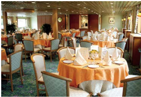
Restaurant an Bord

Willkommen an Bord der RENOIR! Das 1999 in Dienst gestellte Kreuzfahrtschiff der Prestigeklasse der französischen Reederei CroisiEurope verfügt über elegante Gesellschaftsräume. Sie werden sich im Salon mit Bar sowie im Restaurant sicher wohlfühlen. Das Restaurant bietet ausreichend Platz, um die Mahlzeiten in einer Sitzung einzunehmen.