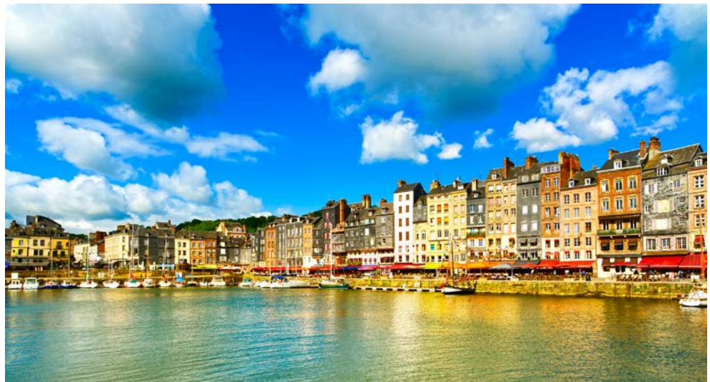
Willkommen in Honfleur

Heute erfolgt die entspannte Busfahrt nach Honfleur. Hier, in diesem bezaubernden Hafenzwischen, werden Sie bereits von der RENOIR zur Einschiffung erwartet. Nach dem Kabinenbezug lernen Sie bei einem Begrüßungsdrink die Mannschaft kennen und nehmen danach im Schiffsrestaurant Platz zu Ihrem