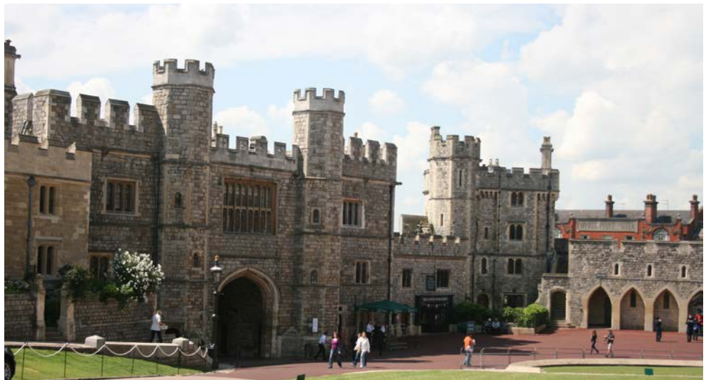
Besuchen Sie Schloss Windsor – auch wenn Königin Elisabeth II. wohl nicht da sein wird, der Anblick lohnt sich