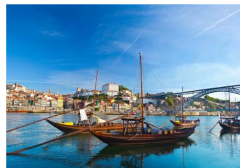
Rabelo, einst ein traditioneller Portwein-Segler

Köstliches aus dem Tontopf, Fisch, Meeresfrüchte und Portwein – auch die Kulinarik dürfte dafür verantwortlich sein, dass Porto im Jahr 2012 zur „Best European Destination“ gewählt wurde. Die reiche Kaufmannsstadt lädt Sie zum Bummeln und Staunen ein – über opulente Barockbauten, enge, gewundene Gassen und Prachtstraßen wie die Rua de Santa Catarina.