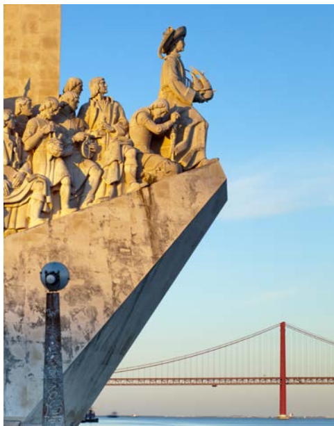
Das Entdecker-Denkmal in Lissabon

Lassen Sie sich vom leicht maroden Charme der Hauptstadt Portugals verzaubern. Lissabon, malerisch an der Flussmündung des Tejo gelegen, lädt Sie mit seinen zahlreichen Sehenswürdigkeiten zum Bummeln und Genießen ein. Nehmen Sie z.B. zu zweit in einem Motorrad-Beiwagen aus dem Jahr 1947 Platz und erkunden Sie mit Ihrem Fahrer die lebhafteste Altstadt Alfama, das noble Chiado oder besuchen Sie das Hieronymus-Kloster.