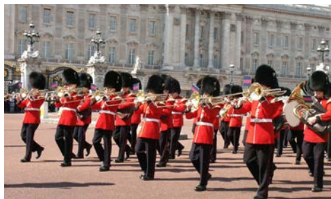
Tradition pur: Zeremonie der Wachablösung in London

Verschaffen Sie sich heute einen ersten Überblick: Erleben Sie z.B. das Gefühl grenzenloser Freiheit auf dem Blauen Balkon auf Deck 14. Die insgesamt ca. 11 qm große Plattform mit gläsernem Boden befindet sich 37 m über der Wasseroberfläche.