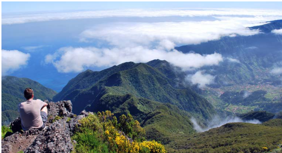
Madeiras Aussichtspunkte bieten grandiose Weitblicke