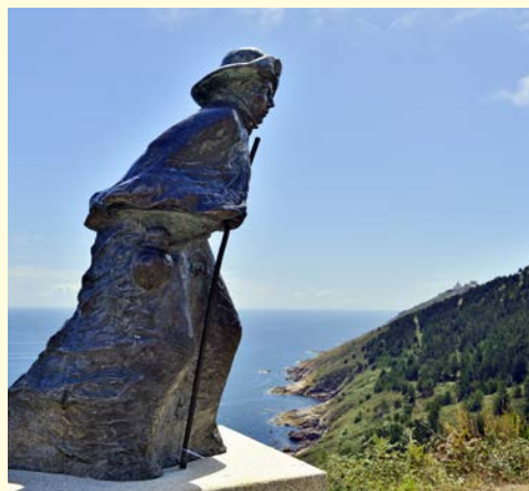
Gehen Sie auf Pilgerschaft nach Santiago de Compostela