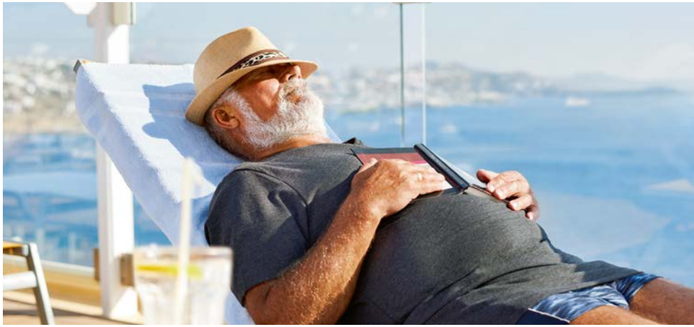
Genießen Sie einfach mal das Nichtstun