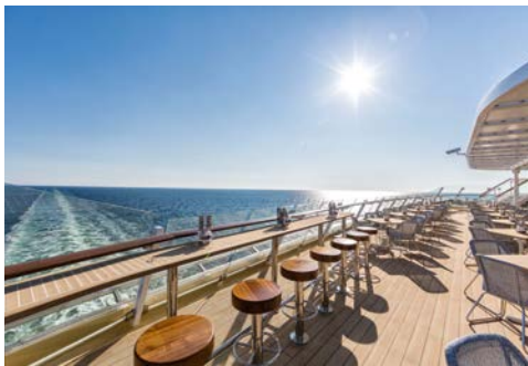
Immer die perfekte Sicht

Beim gastronomischen Angebot erleben Sie Individualität und exzellenten Service. Keine festen Essenszeiten – die Speisen der meisten Restaurants