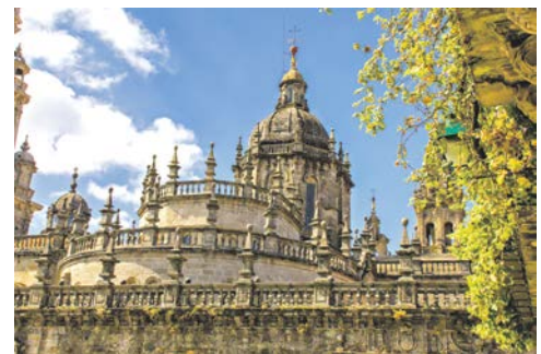
Kathedrale von Santiago de Compostela

Tanken Sie heute neue Energie, z.B. in der finnischen Sauna, wo Sie einen unvergesslichen Panoramablick aufs offene Meer genießen können!