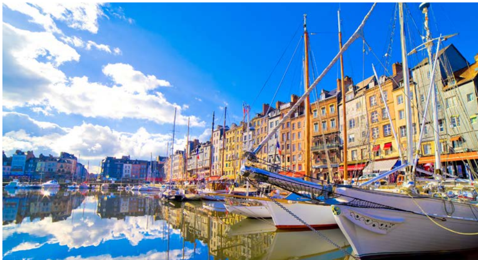
... ebenso wie Honfleur an der Seinemündung