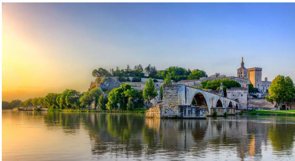
Avignon mit der berühmten Brücke bezaubert ...

Die AMADEUS DIAMOND empfängt Sie am Seineufer, unweit des Eiffelturms. Hier, im Herzen von Paris, beginnt Ihr kleiner Frankreich-Urlaub. Widmen Sie sich ganz den Sehenswürdigkeiten, die Sie schon immer besuchen wollten: Montmartre, Champs Elysées, Eiffelturm oder Louvre. Die Seine-Region, bekannt für ihre malerische Landschaft, hat von jeher viele Impressionisten in den Bann gezogen. Vor allem das einzigartige Licht, welches Kreidefelsen, Wiesen und Wälder so lebendig macht, inspirierte berühmte Maler wie Monet oder Renoir. Die Hafenstadt Rouen wird aufgrund ihrer Geschichte samt zahlreicher Sehenswürdigkeiten gerne auch als Museumsstadt bezeichnet. Erlebnisreich gestaltet sich auch eine Ausflugsfahrt ins charmante Küstenstädtchen Honfleur sowie zu weiteren mondänen Badeorten an der atlantischen Blumenküste. Genießen Sie eine Flussfahrt mit besonderer Vielfalt und dem ständigen Begleiter, der sprichwörtlichen französischen Lebensfreude.