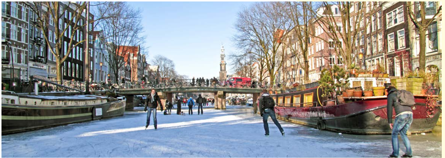
Vielleicht haben Sie Glück und erleben die Amsterdamer Grachten einmal zugefroren