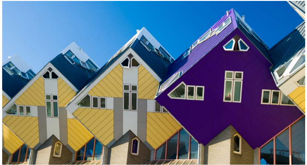
Die Kubushäuser von Rotterdam