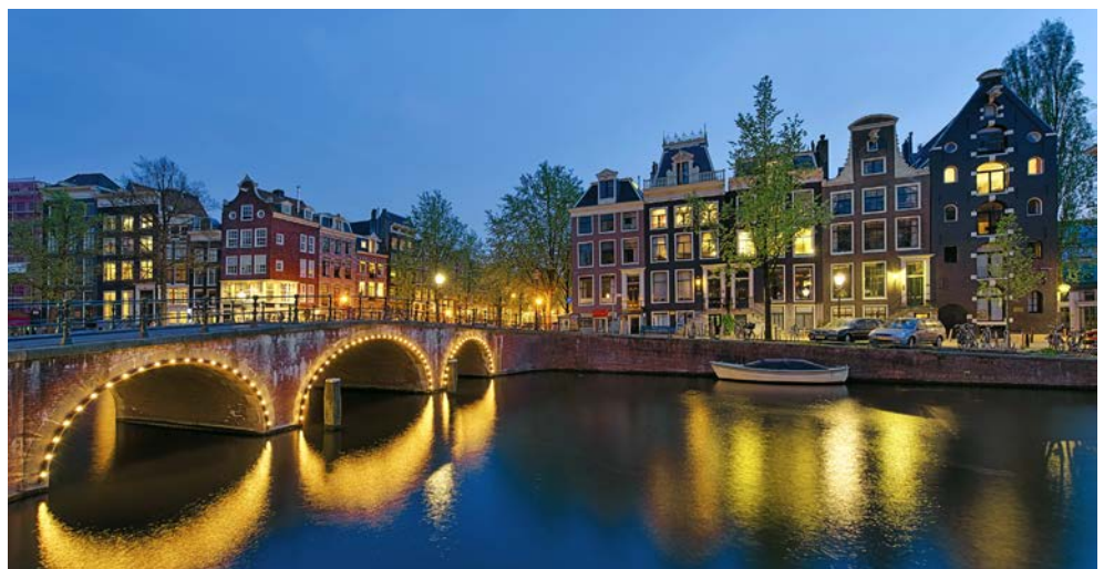
Das illuminierte Amsterdam ist einfach schön

Die Stadt an der Amstel steht, ähnlich wie Venedig, auf unzähligen Pfählen. Sie beeindruckt mit Kanälen, den sogenannten Grachten, und wird von über 1.000 Brücken überspannt. Oberhalb der unzähligen,