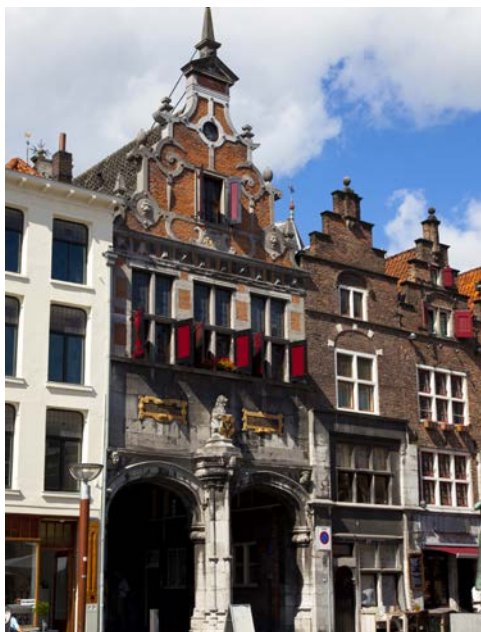
Historische Fassaden in Nijmegen

schmucken Hausboote schmiegen sich die typischen Giebelhäuser aneinander. Viele lebendige Märkte locken Besucher von nah und fern. Wer dagegen Kunstschätze entdecken möchte, der sucht sich unter 40 namhaften Museen das eine aus, von dem er noch seinen Enkeln begeistert erzählen wird. Allen voran das berühmte Rijksmuseum mit Rembrandts Nachtwache – oder doch lieber die einzigartigen Originale im Van Gogh Museum? Amsterdam ist herrlich entspannt, multikulturell, kulturbegeistert, historisch ... einfach fantastisch vielseitig. Vielleicht unternehmen Sie eine Rundfahrt zu großartigen Baudenkmalern, durch kleine Gassen und natürlich zu den historischen Grachten. Lernen Sie diese multikulturelle Metropole mit viel Charme auf einem organisierten Ausflug kennen. Auf der Route „Rhein Rotterdam“ können Sie sich auf eine herrliche Lichterfahrt nach dem Auslaufen aus dem Hafen freuen. Das nächtlich illuminierte Amsterdam wird Ihnen gewiss gefallen.