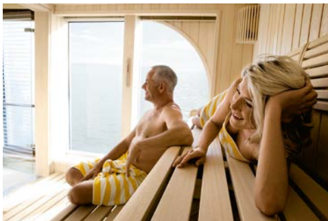
Entspannung im Sanarium

SPA-ROSA: Große Auswahl an Beauty- und Body-treatments mit hochwertigen Produkten von BABOR und La Mer. Professionell ausgebildetes Spa- und Beautyteam. Sanarium mit Panoramablick. Fitnessraum mit modernen Cardiogeräten: Crosstrainer und Ergometer. Erlebnisduschen und Ruheraum. Außenbereich mit Whirlpool, Liegen und Panoramablick.