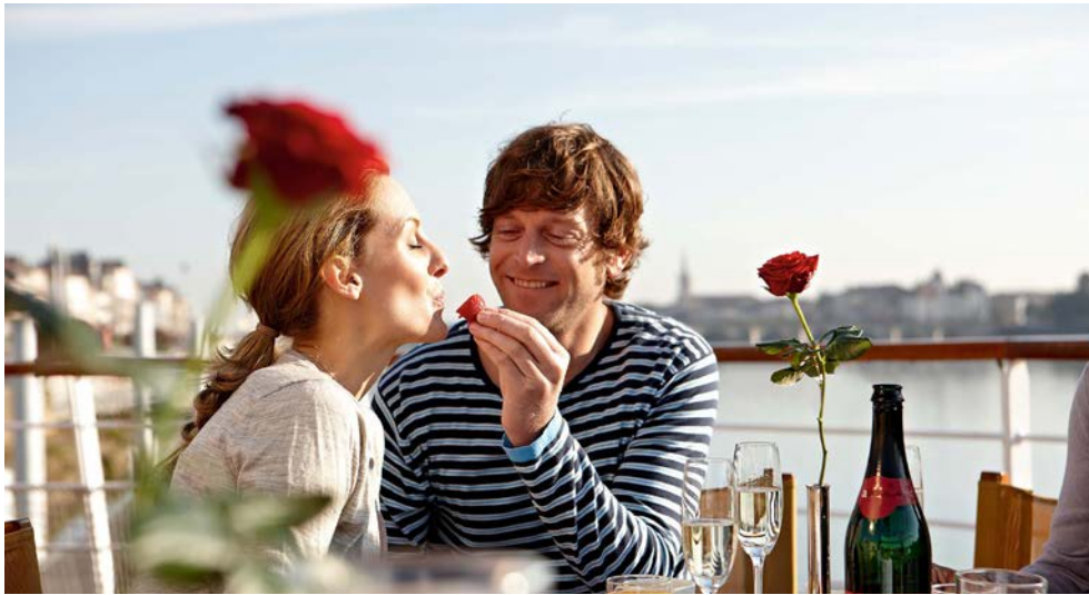
Genießen Sie Ihre Zeit an Bord