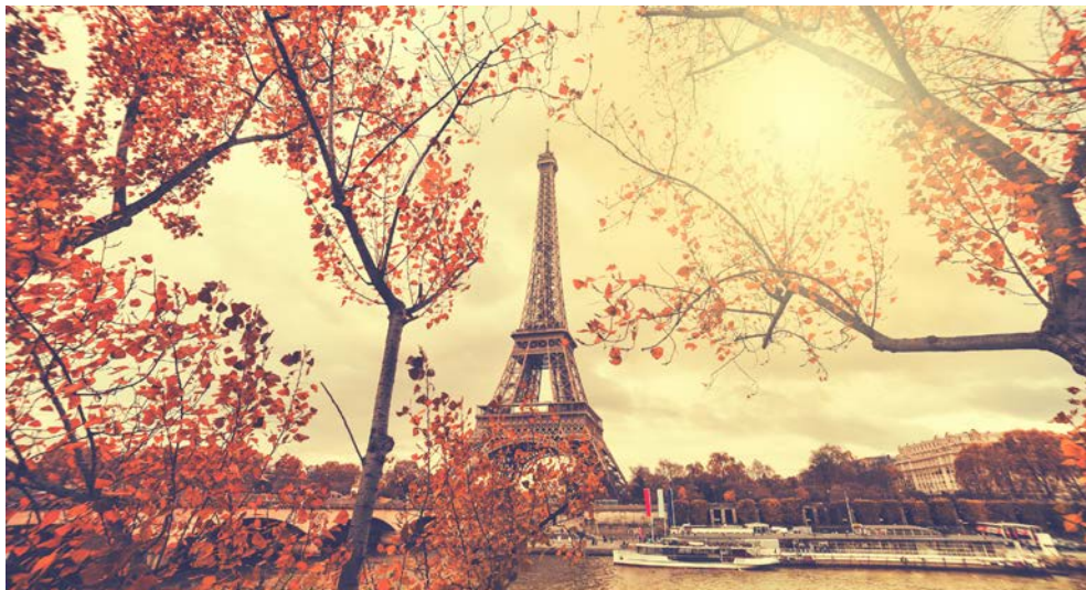
Willkommen in der „Stadt der Liebe“: Bonjour Paris