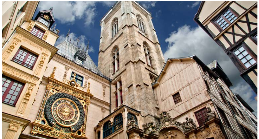
Wunderschöne, historische Bauten in Rouen