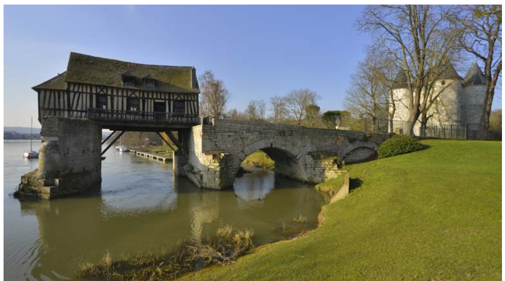
Vernon selbst ist ebenfalls sehr reizvoll

Schon der Name der romantischen Metropole an der Seine lässt das Herz eines jeden Entdeckers höher schlagen. „Paris ist Frankreich“, sagte schon Goethe. Die Metropole an der Seine bildet den Mittelpunkt des Landes. Hier treffen sich alle Verkehrsadern,