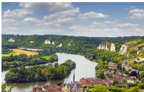
Impressionen der Seine

hier sitzen die meisten Konzerne und Unternehmen sowie die Verwaltung. Und natürlich drängen sich bedeutende Monumente und Sehenswürdigkeiten auf engstem Raum. Hier erwartet Sie ein wahres Feuerwerk an weltberühmten Bauwerken, beeindruckenden Plätzen, prachtvollen Chaussees und zauberhaften Allees. Wandeln Sie auf den Spuren Napoleons über die legendäre Champs-Élysées zum Symbol seiner Macht – dem imposanten Triumphbogen. Bestaunen Sie die gotische Kathedrale Notre-Dame. Oder stauen Sie über den 300 Meter hohen Eiffelturm, dessen