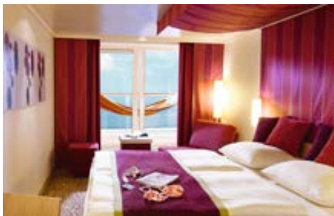
Kabinenbeispiel mit Balkon

Bei der Ausstattung der 1.097 Kabinen wurde größter Wert auf Komfort und Behaglichkeit gelegt. Sie sind ausgestattet mit SAT-TV (interaktiv), Radio, Telefon, Sitzcke, Klimaanlage, Safe und Haartrockner. Wie überall auf dem Schiff überzeugen auch hier modernes Design, freundliche Farben und gut durchdachte Ausstattungsdetails. Besonders beliebt sind die schönen Balkonkabinen, die preislich attraktiven Kabinen mit eigenem, kleinen Sonnendeck. Genießen Sie den Luxus spezieller Spa Kabinen mit direktem Zugang zum Body & Soul Spa Bereich.