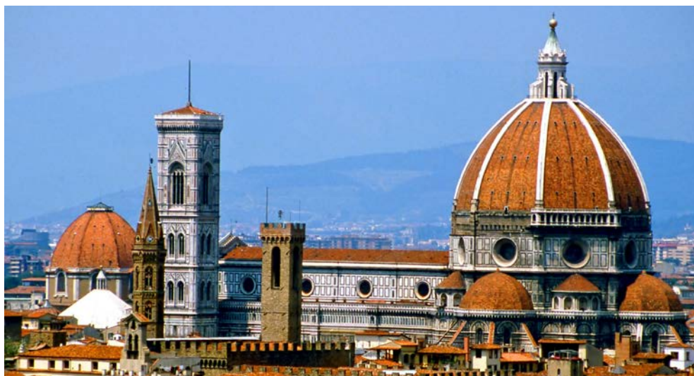
Ein toskanischer Traum für alle Kunstfreunde – Florenz