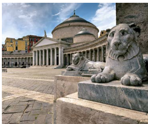
An der Piazza del Plebiscito in Neapel

Großartig – der erste Tag an Bord bietet Ihnen ausreichend Gelegenheit, Ihr Schiff in Ruhe zu erkunden.