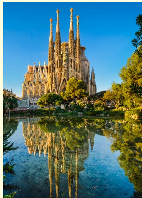
Ob sie je vollendet wird? Sagrada Familia in Barcelona

* gegen Aufpreis auch buchbar ab/bis Hannover + € 20,- p.P. Frankfurt oder München + € 40,- p.P. (Umsteigeverbindungen möglich, je nach Verfügbarkeit)