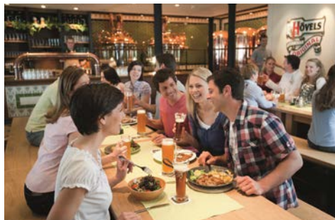
Im bordeigenen Brauhaus

Ein riesiger LED-Screen auf dem Sonnendeck und ein weitläufiges Sportaußendeck machen Ihre Kreuzfahrt mit AIDA Sol zu einem ganz besonderen Erlebnis. Übrigens: Auch auf AIDA Sol finden Sie auf Deck 10 ein Brauhaus auf hoher See. Freuen Sie sich auf ein frisch gezapftes Bier, natürlich an Bord gebraut! Und in den 7 Restaurants finden Sie jeden Tag aufs Neue Köstlichkeiten aus aller Welt. Willkommen an Bord!