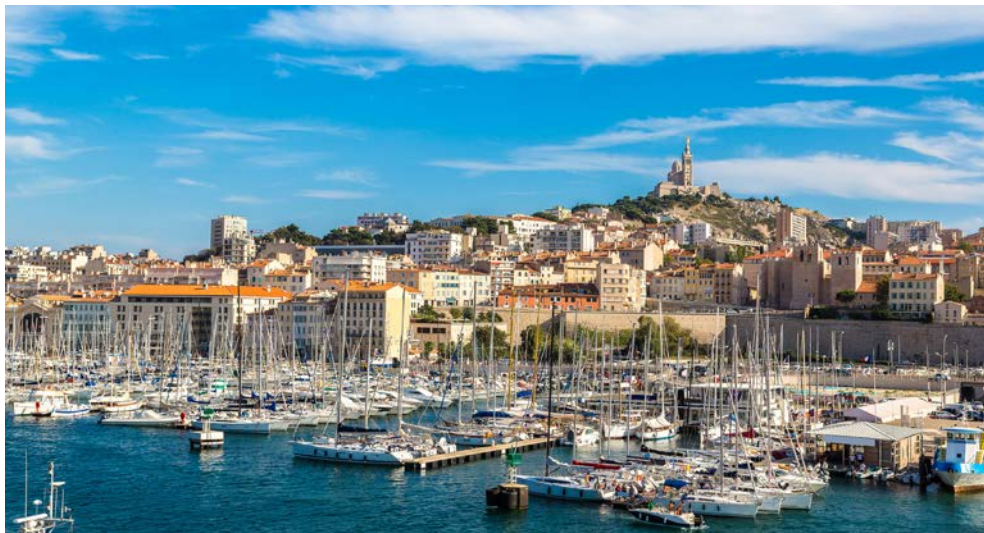
Blick auf den Vieux Port von Marseille