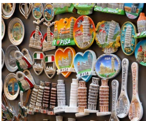
Denken Sie an Souvenirs für die Lieben daheim