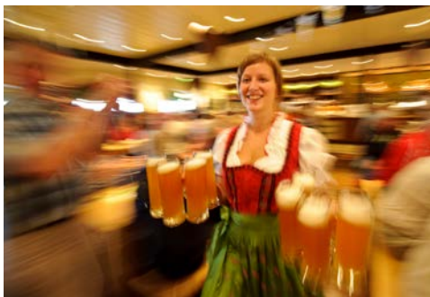
Zünftig geht es im Brauhaus zu

An Bord von AIDAblu verbringen Sie Ihren Urlaub ganz nach Ihrem eigenen Geschmack. Neue Welten bei einer Japanischen Teezeremonie entdecken, das in Kupferkesseln selbstgebraute Bier mit Freunden im Brauhaus genießen oder einfach mal die Seele auf dem Sonnendeck baumeln lassen. Genießen Sie die vollkommene Freiheit, jeden Tag an Bord von AIDAblu neu zu gestalten. Eines bleibt dabei immer gleich, AIDA verwöhnt Sie mit erstklassigen Service.