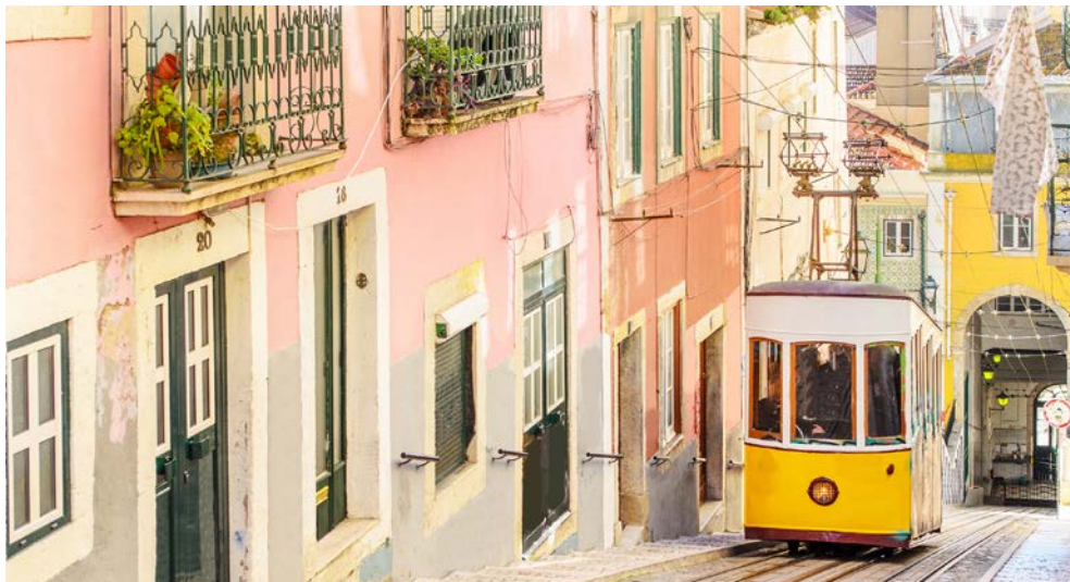
Einer der drei „Straßenbahn“-Fahrstühle in Lissabon

Spaniens! Kolumbus' Schiffe brachten unermessliche Reichtümer in die Stadt, da sie im 17. Jh. über das Handelsmonopol für die Neue Welt verfügte. Von dieser glanzvollen Zeit zeugen noch heute zahlreiche Prachtbauten. Viele Ausflugsmöglichkeiten geben Ihnen die Gelegenheit, facettenreiche Eindrücke der Region zu erhalten: ein Besuch der Königlich-Andalusischen Reitschule oder ein Spaziergang durch das alte Stadtzentrum von Cádiz mit der Camera obscura. Hier gibt es viel zu entdecken!