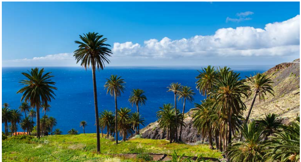
Willkommen auf La Gomera