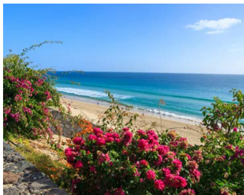
Die herrlich langen Sandstrände Fuerteventuras

Nichtstun ist auf Fuerteventura besonders schön. Der Strand von Corralejo lädt Sie ein, einmal so richtig abzuschalten und herrlich zu entspannen. Genießen Sie die Sonne der Kanarischen Inseln oder machen Sie es sich im Schatten der Palmen bequem. Es lohnt sich auch, der bunten Unterwasserwelt einen Besuch abzustatten. Also auf zur Pirateninsel Los Lobos! Unter der Führung eines AIDA Guides entdecken Sie beim Schnorcheln die grandiosen Schätze der Unterwasserwelt und schließen Bekanntschaft mit den Fischeschwärmen des Atlantischen Ozeans.