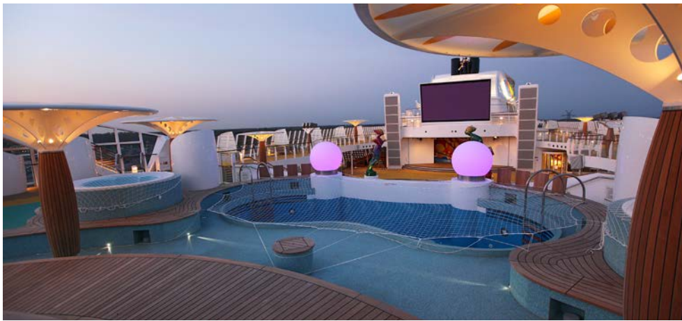
AIDA bietet Ihnen tolle Decksflächen für einen entspannten Urlaub