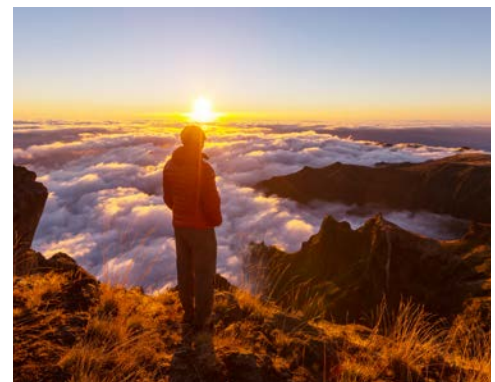
Die vielen Aussichtspunkte auf Madeira sind grandios

Jetzt wird es bunt! Nach Ihrer Begegnung mit den unendlichen Weiten des Atlantiks empfängt Sie Madeira mit einem exotischen Blütenmeer. Prachtvolle Blumen wie Orchideen und Strelitzien blühen das ganze Jahr hindurch und lassen den Frühling hier niemals enden. Besonders ein Spaziergang durch den botanischen Garten in der Hauptstadt Funchal wird Blumenfreunde begeistern. Wer etwas mehr Spannung sucht, wird im Süden der Insel fündig. Cabo