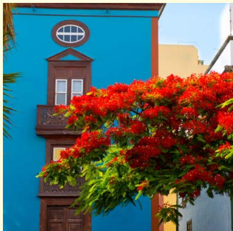
Schöne Häuserfassaden auf La Palma

* Bei der Reise am 29.01.2018 werden die Häfen San Sebastian und Santa Cruz/La Palma in umgekehrter Reihenfolge angelaufen.