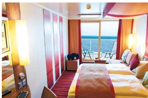
Kabinenbeispiel mit Balkon

AIDAbella verfügt insgesamt über 1.025 Kabinen, von denen die meisten Außenkabinen über einen eigenen Balkon oder ein separates Sonnendeck verfügen. Bei der Einrichtung wurde größter Wert auf Komfort und Behaglichkeit gelegt, und wie überall auf dem Schiff überzeugen auch hier modernes Design, warme, freundliche Farben und gut durchdachte Ausstattungsdetails. Der besondere Ruhepunkt ist die Wellness Oase – ein Paradies der Entspannung und Erholung. Im AIDA Body & Soul Spa (2.300 m²) werden Körper und Seele mit Sauna, Shiatsu, Massage, Thalasso und La Stone aufs Schönste verwöhnt. In der Hängematte oder in Relaxliegen zwischen Palmen träumen, im Whirlpool abtauchen – das alles völlig wetterunabhängig, verbunden mit einem gläsernen Patio mit auffahrbarem Dach. Hier ist jeden Tag bei jedem Wetter das perfekte Klima.