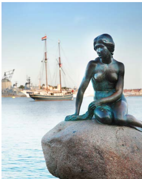
Winken Sie der „Kleinen Meerjungfrau“

Kopenhagen ist weit mehr als die „Kleine Meerjungfrau“. Die Heimatstadt des Märchendichters Hans Christian Andersen bereitet Ihnen fantastische Urlaubserlebnisse. Im Tivoli, einem der ältesten Vergnügungsparks der Welt, erwarten Sie Jahrmaktnostalgie und Freizeitspaß. Am Nyhavn kehren Sie in eines der zahlreichen Cafés ein und lassen die Stimmung des alten Hafens mit seinen historischen Seglern auf sich wirken. Schauen Sie danach unbedingt für ein Erinnerungsfoto bei der Kleinen Meerjungfrau am Ende der Uferpromenade vorbei – die Bronzefigur ist ein Muss jedes Kopenhagen-Besuchs.