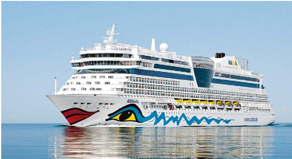
Willkommen an Bord