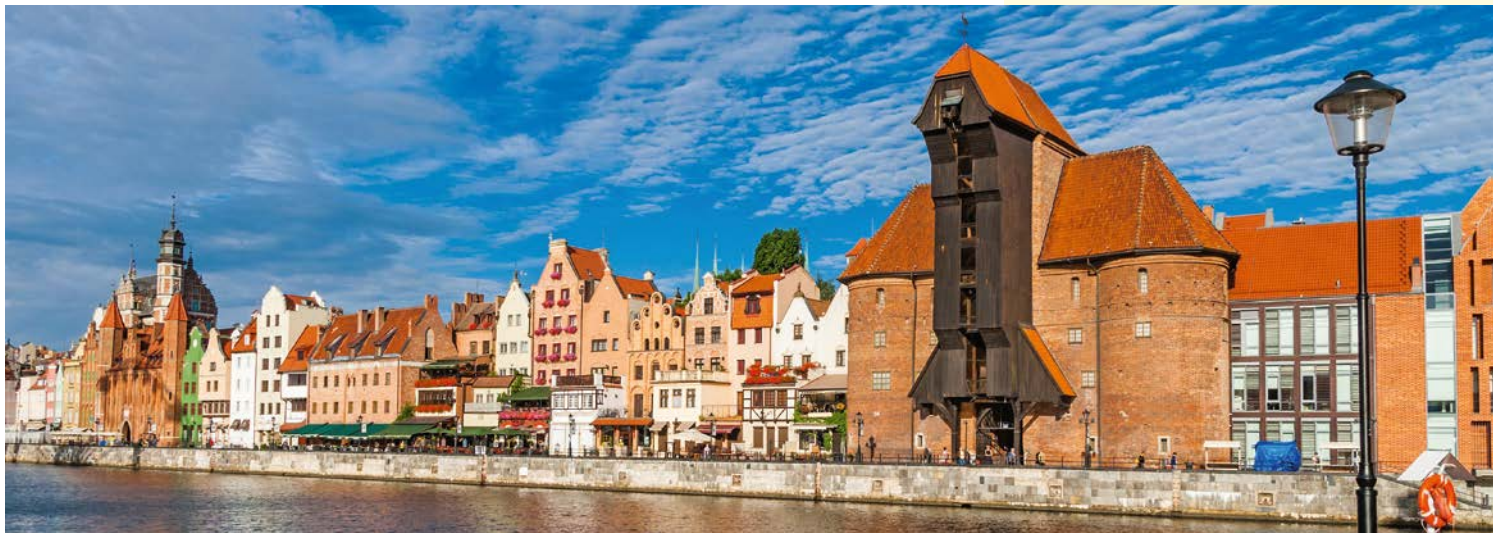
Freuen Sie sich auf die Hansestadt Danzig

St. Petersburg ist nämlich nicht nur das russische „Fenster zum Westen“, sondern auch ein Schaufenster faszinierender Kulturschätze. Unter den 2.300 Prunkbauten der historischen Innenstadt ragt der Winterpalast mit der berühmten Kunstsammlung der Eremitage heraus. Besuchen Sie „Russlands Louvre“!