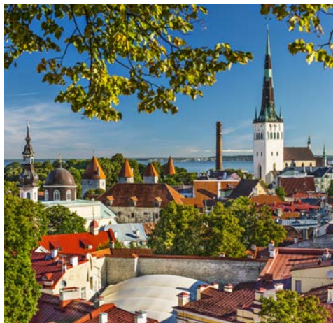
Tallinn – die Stadt der Türme

AIDAbella steht für begehrenswerte Schönheit und vollendete Form. Sie begeistert mit dem gläsernen Theatrum – einem Treffpunkt für Shows und Live-Musik im Stil einer italienischen Piazza. Kino zum Fühlen und Riechen erleben Sie im schwimmenden 4D-Kino. Lassen Sie sich verzaubern von aufregender Architektur und faszinierendem Design im afrikanischen Stil – in diese Schönheit muss man sich einfach verlieben.