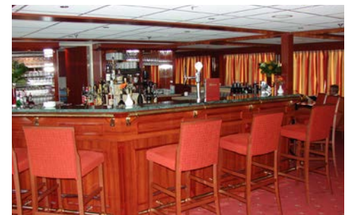
Bar an Bord