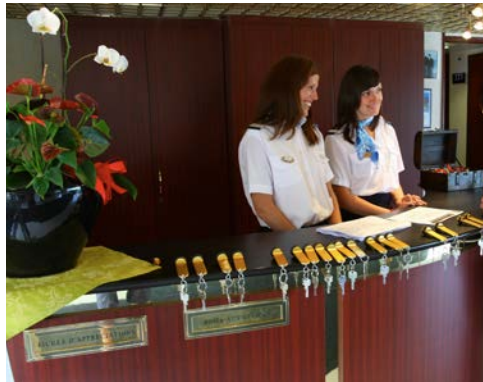
Stand 12/14 - alle Angaben ohne Gewähr.