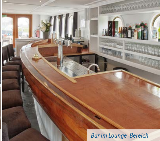
Bar im Lounge-Bereich