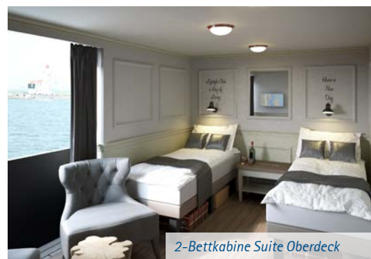
2-Bettkabine Suite Oberdeck