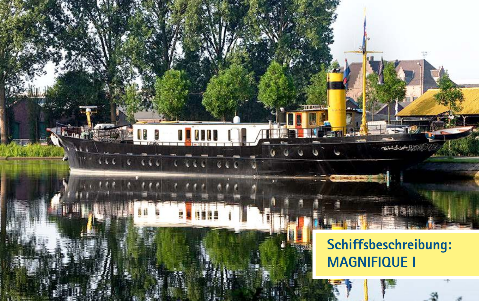
Schiffsbeschreibung: MAGNIFIQUE I