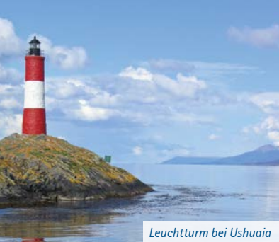
Leuchtturm bei Ushuaia