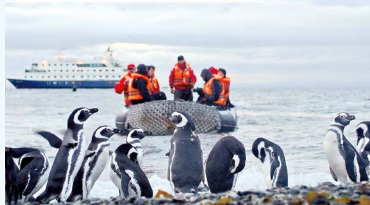
Mit etwas Glück werden Sie von Einheimischen willkommen geheißen