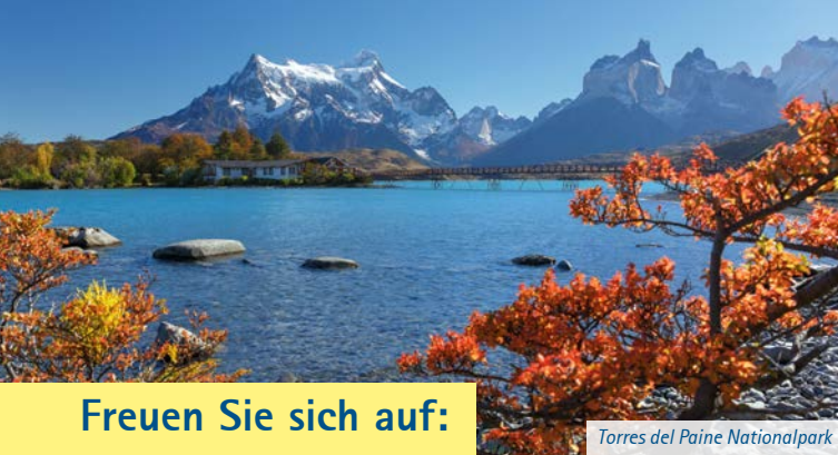
Torres del Paine Nationalpark