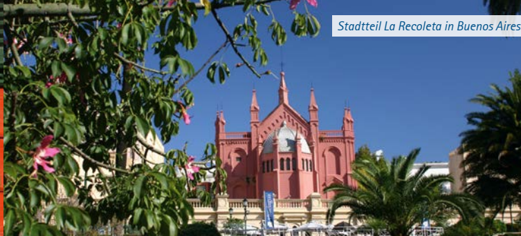
Stadtteil La Recoleta in Buenos Aires