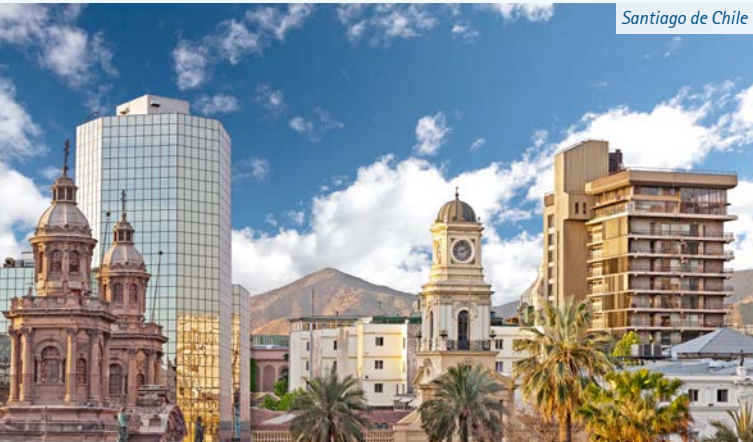
Santiago de Chile