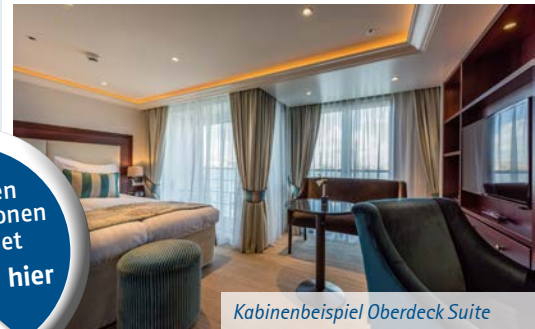
Kabinenbeispiel Oberdeck Suite