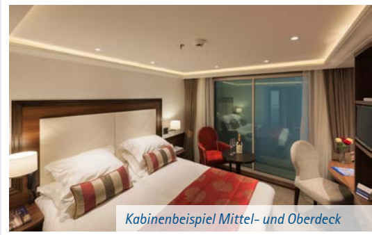
Kabinenbeispiel Mittel- und Oberdeck