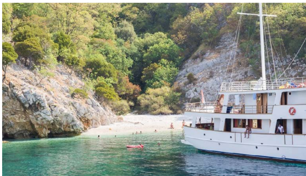
In romantischen Badebuchten

Bitte beachten Sie: Die Anlandungen sind wind- und wetterabhängig, der genaue Fahrplan wird vom Kapitän vor Ort festgelegt. Die Sicherheit von Passagieren und Mannschaft geht in jedem Fall vor.