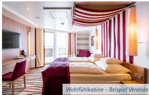
Wohlfühlkabine – Beispiel Veranda