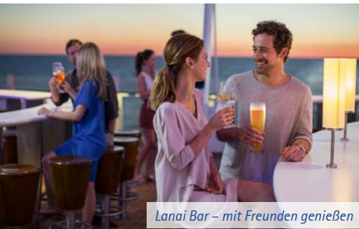
Lanaï Bar – mit Freunden genießen