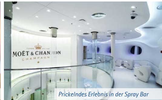
Prickelndes Erlebnis in der Spray Bar