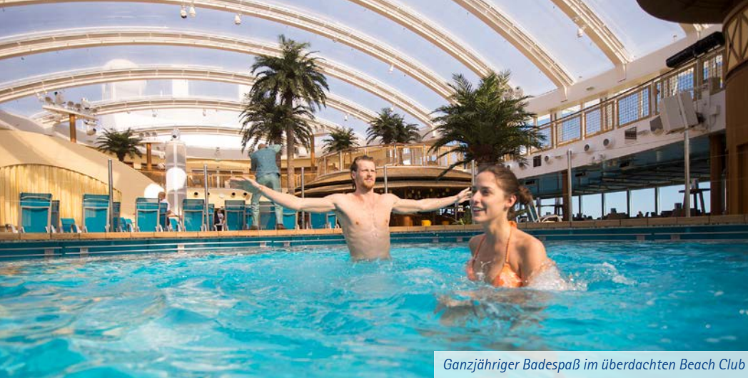
Ganzjähriger Badespaß im überdachten Beach Club