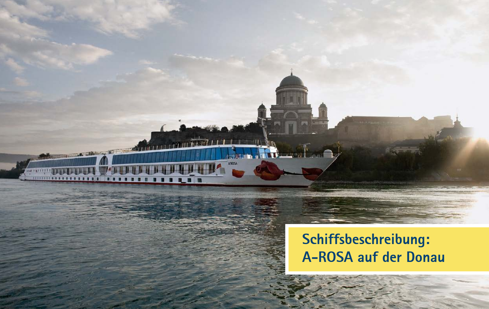
Schiffsbeschreibung: A-ROSA auf der Donau