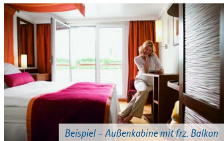
Beispiel – Außenkabine mit frz. Balkon

Die 99 komfortablen Außenkabinen (Nichtraucher) sind 14,5 m 2 groß und mit Dusche/WC, Telefon, Haartrockner, Safe mit individuell einstellbarem Zahlencode, SAT-TV und einer individuell regulierbaren Klimaanlage ausgestattet. Sie verfügen größtenteils über einen französischen Balkon. Die Fenster können nur in den Kategorien 2-Bett-Außenkabine C und D mit französischem Balkon geöffnet werden. In der Kategorie S verfügen die Kabinen über getrennte Betten und ein Zusatzbett.