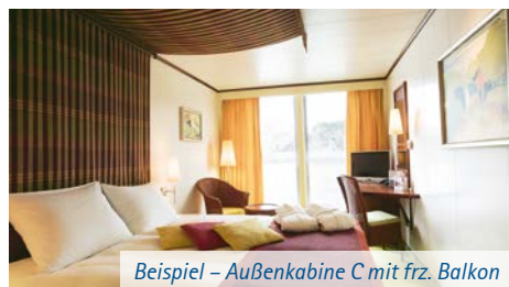
Beispiel – Außenkabine C mit frz. Balkon

fon, Haartrockner, Safe mit individuell einstellbarem Zahlencode, SAT-TV und einer individuell regulierba- ren Klimaanlage ausgestattet. Sie verfügen größtent- teils über einen französischen Balkon. Die Fenster können nur in der Kategorie 2-Bett-Außenkabine C mit französischem Balkon geöffnet werden. Die Schiffe verfügen in der Kategorie A über Kabinen mit einem Doppelbett und Zusatzbett.