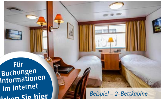
Beispiel – 2-Bettkabine