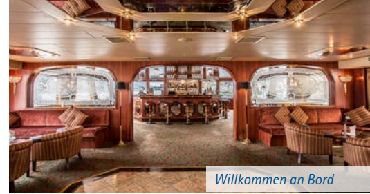
Willkommen an Bord