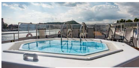
Whirlpool auf dem Oberdeck