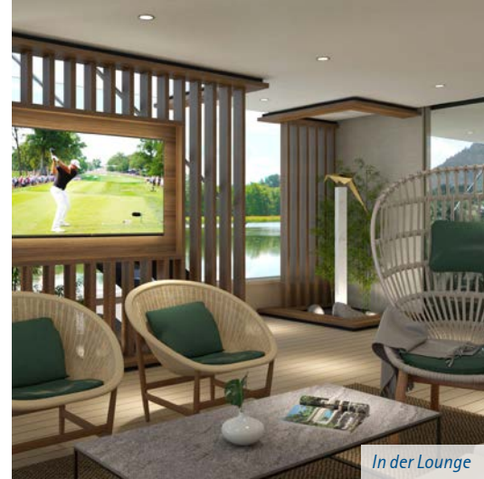
In der Lounge