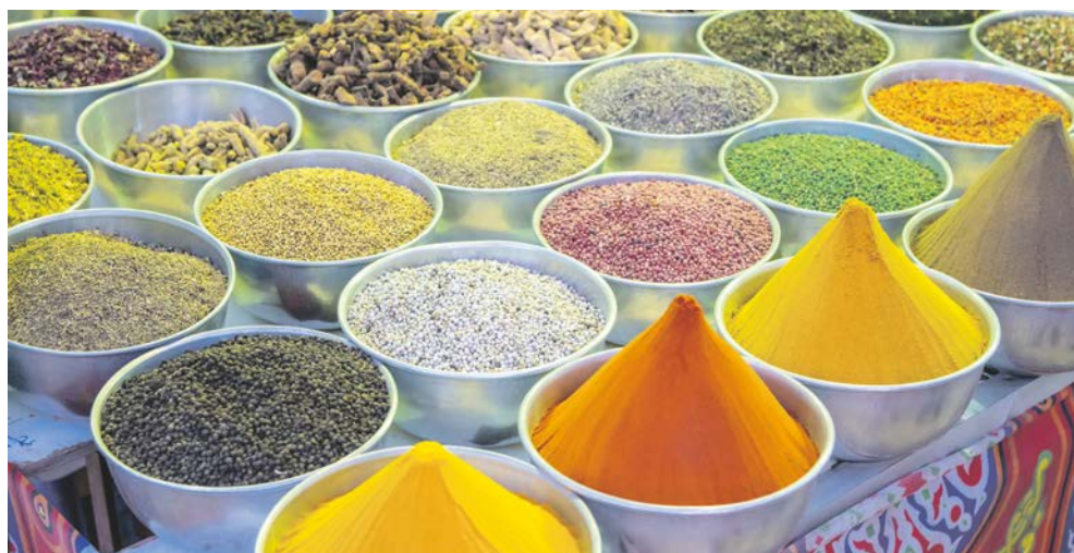
Einmalige Düfte auf den Märkten

Genießen Sie einen Tag zur freien Verfügung an Bord Ihres Nilschiffes.