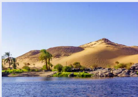
Herrliche Landschaft entlang des Nils

Nach ereignisreichen Tagen entspannen Sie in einem All inclusive Strandhotel in Hurghada mit Privatstrand am Roten Meer. Die Anlage verfügt über Geschäfte, Cafés, diverse Pools und einen Aqua-Park. WLAN können Sie in der Lobby kostenfrei nutzen. Die Zimmer verfügen über viele Annehmlichkeiten und haben einen Balkon oder eine Terrasse.