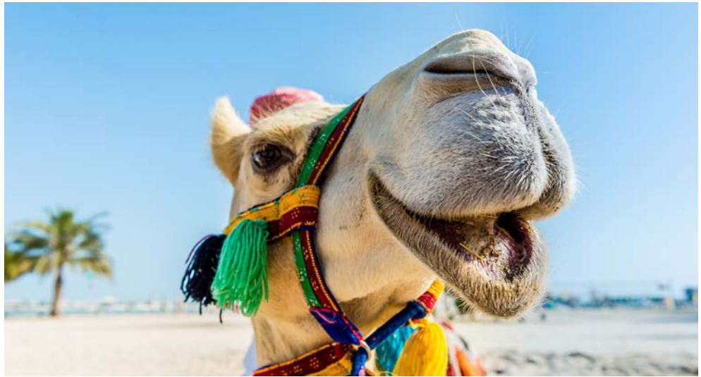
Herzlich willkommen in Ägypten