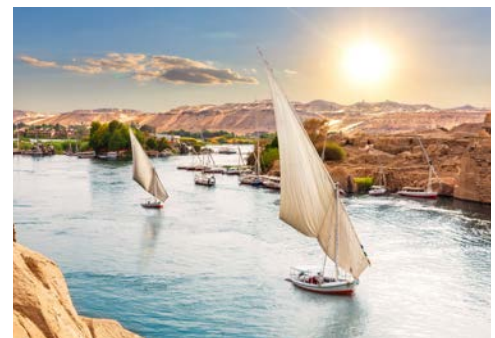
Feliken auf dem Nil

Sie besuchen heute den Horus-Tempel, einen der am besten erhaltenen Tempel der altägyptischen Religion. Eine wunderschöne Falkenstatue schmückt den Eingang. Zurück an Bord können Sie die Landschaft des Niltals auf Ihrer Weiterfahrt nach Assuan genießen.