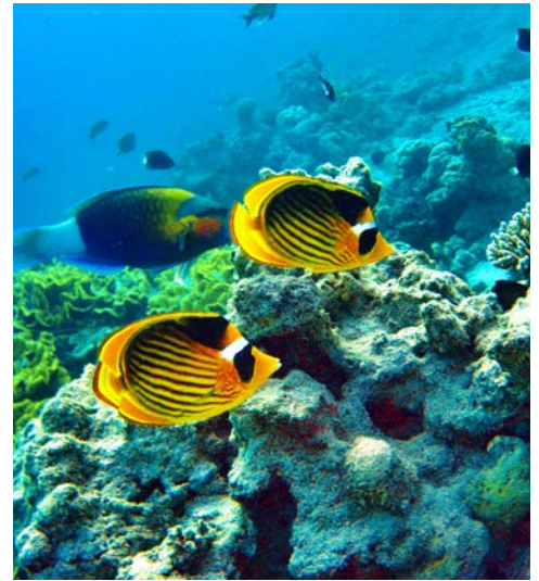
Unterwasserwelt im Roten Meer

Heute endet Ihre erlebnisreiche Reise in Ägypten. Mit vielen neuen „Erinnerungen im Gepäck“ fliegen Sie zurück.