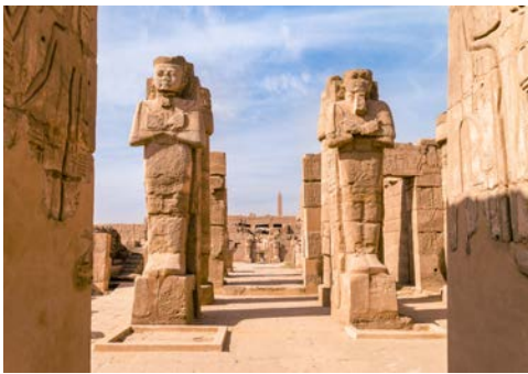
Karnak-Tempel in Luxor

kurz vor der Fertigstellung wegen eines Gesteinsris- ses aufgegeben wurde. Nachmittags fährt Ihr Schiff bis Kom Ombo. Die Tempelanlage von Kom Ombo ist wunderschön direkt am Nilufer gelegen. Der Doppel- tempel ist den Göttern Sobek und Haroeris geweiht. Abends erreicht Ihr Schiff Edfu.