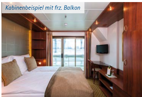
Kabinenbeispiel mit frz. Balkon

Die SWISS RUBY ist im Jahr 2023 Kulturschiff der VIVA Cruises Flotte. Freuen Sie sich an Bord auf thematisch zur Route passende kulturelle Highlights! Das Schiff verfügt über 44 komfortable Außenkabinen für max. 88 Gäste, verteilt auf zwei Decks. Das Sonnendeck lädt zum Verweilen und Genießen der vorbeiziehenden Landschaft ein, im Restaurant verwöhnt Sie die hervorragende Bordküche mit abwechslungsreichen Menüs und in der Panorama-Lounge genießen Sie renommierte Weine oder einen Sommer-Cocktail. Die Crew wird Sie derweil mit dem bekannt guten Service umsorgen.