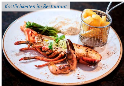
Köstlichkeiten im Restaurant

Kleidung: Sportliche, bequeme Kleidung ist tagsüber angebracht sowie eine warme Jacke für den Aufenthalt an Deck. Es besteht kein Kleiderzwang, jedoch sind Shorts, Badesachen o.ä. im Restaurant nicht erwünscht.