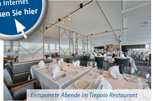
Entspannte Abende im Tiepolo Restaurant