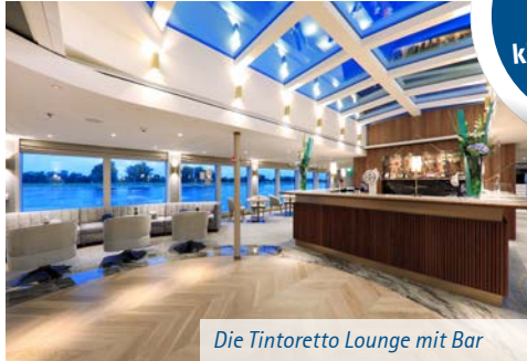
Die Tintoretto Lounge mit Bar