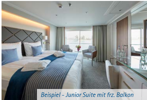
Beispiel - Junior Suite mit frz. Balkon