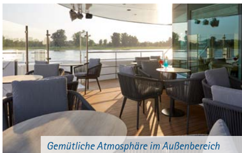
Gemütliche Atmosphäre im Außenbereich

LADY DILETTA Kabinen – Ihr Zuhause auf See! Insgesamt stehen 91 komfortable Kabinen bzw. Suiten auf drei eleganten Kabinendecks für 173 Passagiere zur Auswahl, davon: