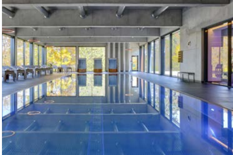
20 m Sportbecken im Hotel