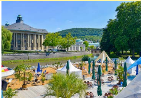
Der Stadtstrand an der Saale