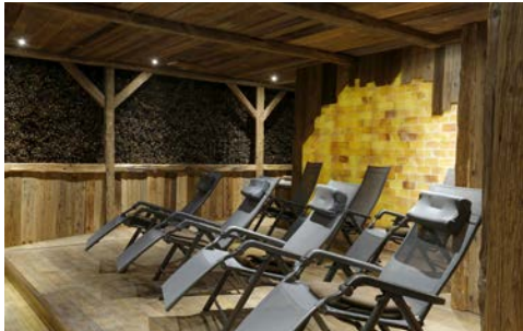
Im hoteleigenen Gradierwerk