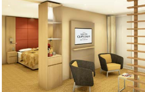
Junior Suite (Architekturskizze)