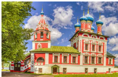
Dimitri-Blutkirche in Uglitsch

Eine ausführliche Stadtrundfahrt zeigt Ihnen die wichtigsten Sehenswürdigkeiten der imposanten Metropole. Mit ihren mächtigen Kathedralen, reich bestückten Galerien, wunderschönen Sakralbauten, pompösen Plätzen und ihrem grandiosen Zentrum, dem Kreml, beeindruckt Moskau jeden. Nirgendwo zeigt sich die Pracht deutlicher als auf dem Roten Platz. Die bunten Zwiebeltürme der Basilius-Kathedrale leuchten hier seit Jahrhunderten in der Sonne. Das russische Wort „Kreml“ bedeutet Festung oder ummauerte Stadt. Der Moskauer Kreml ist nicht der einzige, wohl aber der größte und berühmteste Kreml des Landes. Die heutigen roten Backsteinmauern stammen aus dem Jahr 1495, wurden aber seitdem mehrmals restauriert. Jeder der 20 Türme hat eine Geschichte und seine architektonischen Eigenheiten. Am bekanntesten ist der dem Roten Platz zugewandte 70 m hohe Erlöserturm mit dem roten Stern. Darüber hinaus befinden sich auf dem Kremlgelände Paläste und Kathedralen, wie z. B. die Maria-Verkündung-, Maria-Entschlafene- und die Erzengelkathedrale.