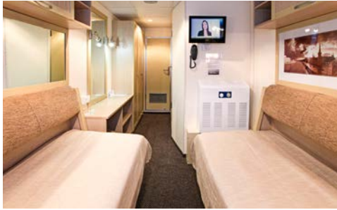
Kabinenbeispiel, Standard (Haupt/Oberdeck)

Entdecken Sie die freundlich-heimelige Atmosphäre der PETER TSCHAIKOWSKI . Mit seinen 5 Decks garantiert das im Jahr 2011 generalsanierte und modernisierte Schiff eine behagliche Reise, das dank seines Sonnendecks und dem umlaufenden Panoramadeck seinen rund 200 Passagieren größtmöglichen Sichtkomfort auf die vorbeiziehende Landschaft bietet.