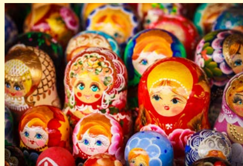
Denken Sie auch an Souvenirs