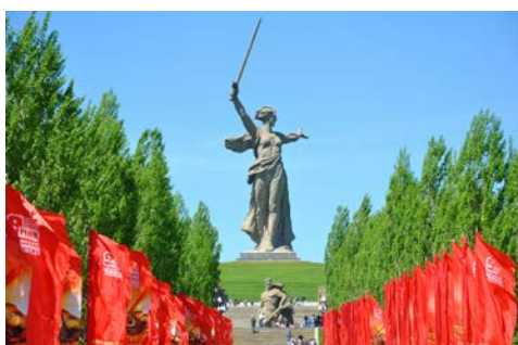
Wolgograd – Mamajew-Hügel

Das ehemalige Stalingrad ist eine aufstrebende Metropole. Im Rahmen des Ausflugs pakets besichtigen Sie die Gedenkstätte der Schlacht von Stalingrad auf dem Mamajew-Hügel. Hier steht die größte Statue der Welt, die „Mutter Heimat“. Höhepunkt der Besichtigung des Mamajew-Hügel ist sicher der Besuch der Halle des Ruhmes.