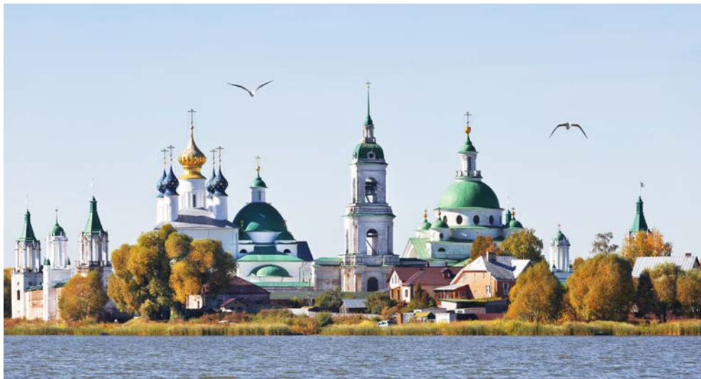
UNESCO Weltkulturerbe in Rostow mit Erlöserkirche und Mariä-Entschlafens-Kathedrale