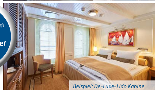
Beispiel: De-Luxe-Lido Kabine