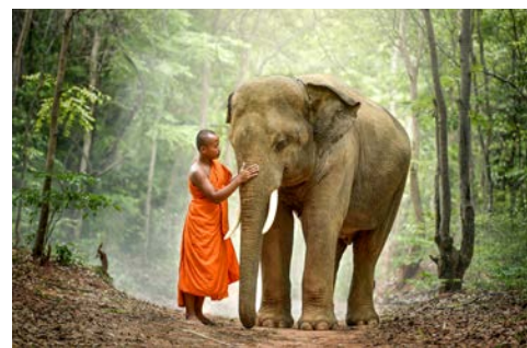
Elefant in Laos