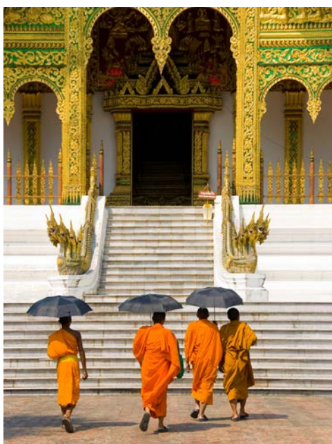
Alte Tempel und Mönchsrituale in Luang Prabang

das älteste Kloster der Stadt. Neben zahlreichen Tempeln bereichert auch die französische Kolonial-Architektur die Stadt. (F/M)