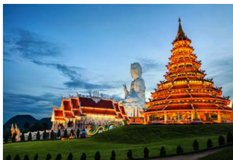
Chiang Rai – Wat Huai Pla Kung Temple

Ein Ausflug bringt Sie an das berühmt-berüchtigte Goldene Dreieck bei Chiang Saen, wo Sie den Goldenen Buddha von Sop Ruak und das multimediale Museum Hall of Opium besichtigen, das die Geschichte des heute verbotenen Opium-Anbaus erzählt. Anschließend fahren Sie nach Chiang Rai, wo Sie eine Nacht im Komfort-Hotel in Chiang Rai logieren. (F/M/A)