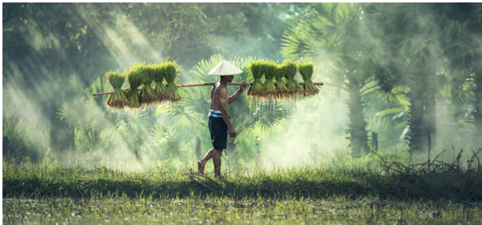
Ganz traditionell – ein Reisfarmer in Laos