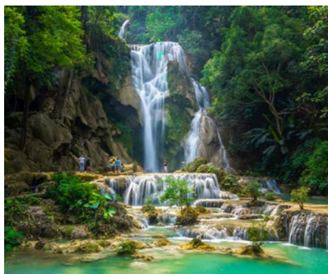
Die Wasserfälle von Kuang Si

Auch der heutige Tag bezaubert wieder mit herrlichen Landschaftspanoramen. Am Ufer tauchen immer wieder Reisterrassen und Bananenpflanzungen zwischen einzelnen Teakholz-Beständen auf, während Ihr Schiff in Richtung Sanakham fährt. Erfreuen Sie sich an den Panoramen in dieser unerschlossenen Region und beobachten Sie die einheimischen Fischer und das Alltagsleben der Dorfbewohner entlang des Flusses. (F/M/A)