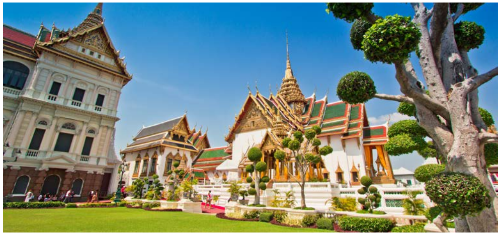
Der Königspalast in Bangkok