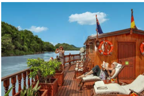
Entspannen Sie auf dem Sonnendeck