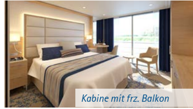
Kabine mit frz. Balkon