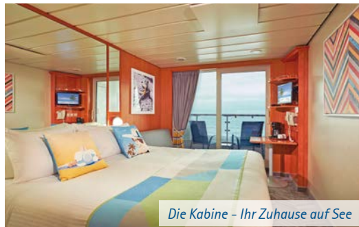
Die Kabine – Ihr Zuhause auf See