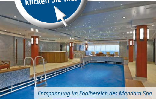
Entspannung im Poolbereich des Mandara Spa