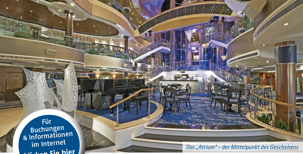
Das „Atrium“ – der Mittelpunkt des Geschehens