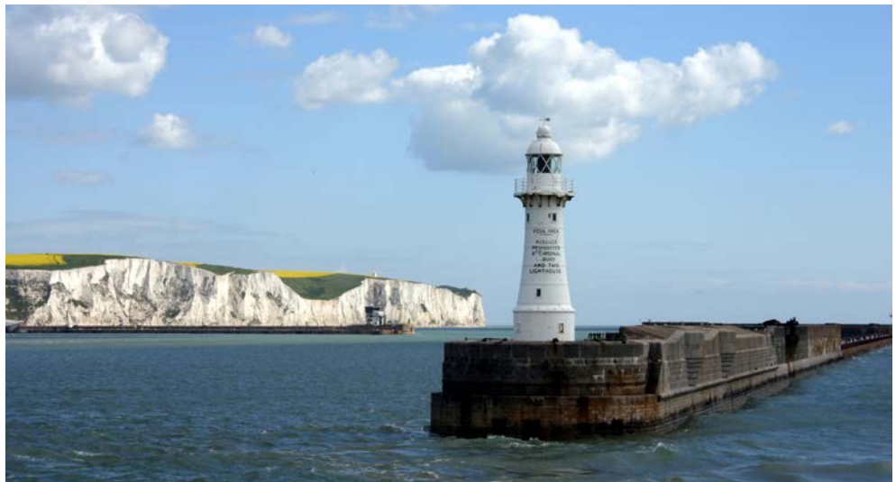
Die berühmten Weißen Klippen von Dover