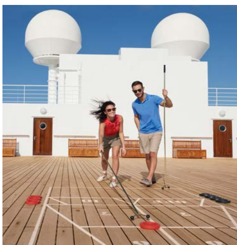
Wie wäre es mit einer Partie Shuffleboard

dafür, dass Sie sich rund um die Uhr wunschlos glücklich fühlen. Aus dem bisherigen „Winter Garden“ z.B. ist die neue Carinthia Lounge entstanden – elegant und luftig, tagsüber ein Ort zum Entspannen bei leichten Speisen, abends eine elegante Premium-Weinbar mit zwanglosem Unterhaltungsprogramm.