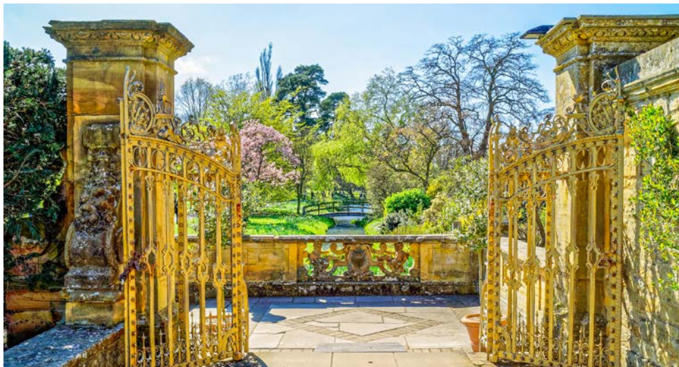
Gartenanlage von Hever Castle