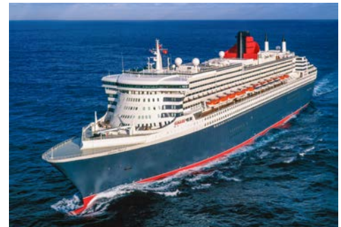
Die QUEEN MARY 2

Historisch und doch modern, multikulturell und zugleich ganz traditionell – Sie befinden sich in einer der spannendsten Städte Europas! St. Paul's Cathedral, Westminster Abbey, Buckingham Palace, Downing Street, Whitehall, Tower of London, Big Ben, Houses of Parliament, Piccadilly Circus, Trafalgar Square ... die Höhepunkte Londons nehmen kein Ende und werden doch nie langweilig. Diese und viele weitere Sehenswürdigkeiten werden Ihnen auf Ihrer Stadtrundfahrt nähergebracht. Anschließend erfolgt der Transfer nach Southampton, hier erwartet Sie schon die QUEEN MARY 2 zur Einschiffung. Majestätisch, elegant, formvollendet – genießen Sie diesen ersten Tag an Bord und kosten Sie das herrliche Gefühl, den Alltag hinter sich gelassen zu haben, richtig aus.