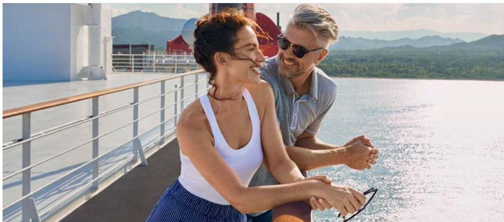
Genießen Sie Ihre Zeit an Board

Ein großartiger Tag der Entspannung, Erholung und Abwechslung liegen vor Ihnen. Vielleicht haben Sie ja Lust, all die schönen Dinge an Bord zu entdecken: Zu den herausragenden Attraktionen an Bord zählen auch der Joggingpfad auf Deck 7, der traumhaft schöne Canyon Ranch SpaClub®, die glamourösen Shows im Royal Court Theatre und die faszinierenden Vorführungen im Illuminations – dem ersten Planetarium auf See. Und wohin Ihre Wege Sie auch führen: Der legendäre White Star Service™ ist ein Garant