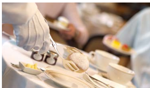
Lassen Sie sich rundum verwöhnen

dafür, dass Sie sich rund um die Uhr wunschlos glücklich fühlen. Aus dem bisherigen „Winter Garden“ z.B. ist die neue Carinthia Lounge entstanden – elegant und luftig, tagsüber ein Ort zum Entspannen bei leichten Speisen, abends eine elegante Premium-Weinbar mit zwanglosem Unterhaltungsprogramm.