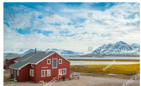
Ny-Ålesund könnte auf Ihrem Programm stehen

pittoresken Mischung aus alter und neuer Architektur. Gut möglich, dass Sie auch den Magdalenefjord besuchen und Gravneset, wo die Hartgesotenen schwimmen können, um den speziellen arktischen Schwimmschein zu erwerben. Wo immer Sie unterwegs sind, können Sie das Expeditionsteam begleiten: auf Anlandungen, Eisfahrten und vielem mehr.