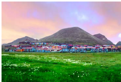
Überraschend bunt – frühlingshaftes Longyearbyen

Ihr Flug bringt Sie von Deutschland über Oslo nach Spitzbergen. Willkommen auf 78° N! Dort angekommen, werden Sie eine ganz andere Welt entdecken: Longyearbyen ist eine kleine Stadt am Rande der riesigen arktischen Tundra. Transfer zu Ihrem Hotel und Übernachtung.