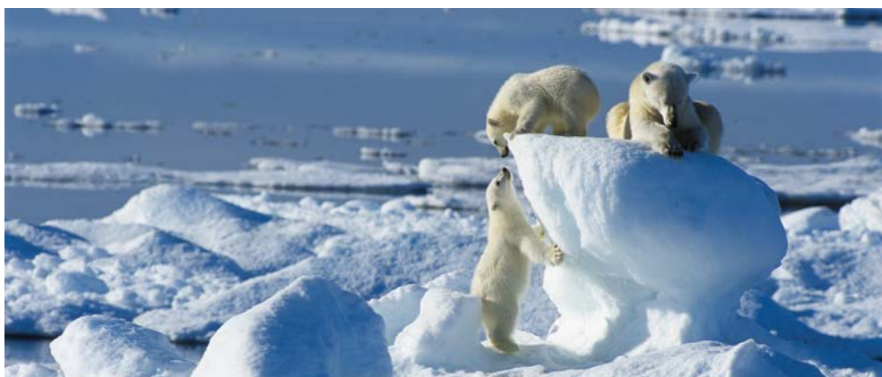
Ein unvergesslicher Anblick

Limitiertes Kontingent. Gültig für Neubuchungen bis zum 28.02.2019 zum Frühbuche Preis. Vorbehaltlich verfügbar. Der Betrag wird in NOK als Bordguthaben auf der Cruise Card erscheinen und gilt bei Doppelbelegung: 9.500,- NOK im Wert von ca. € 1.000,-. Umrechnung je nach Wechselkurs zur Zeit der Reise. Bei Einzelbelegung der Kabine wird die Hälfte des Betrags gewährt. Keine Barauszahlung. Nicht kombinierbar mit anderen Angeboten.