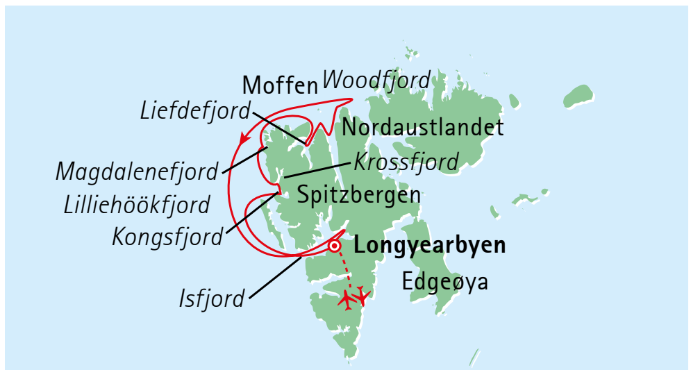
Ihre fantastische Reiseroute