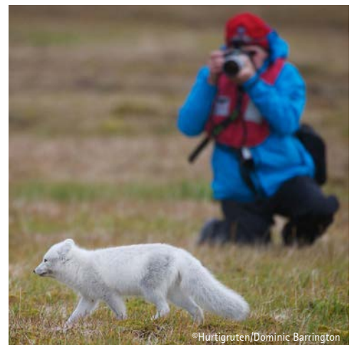
Das Expeditionsteam bringt Sie ganz nah ran!

Geplant ist der Besuch des Kongsfjords, eines der schönsten Fjordgebiete Spitzbergens mit mächtigen Gletschern und Eisbergen, die ins Meer kalben, umrahmt von atemberaubenden Bergformationen. Eine weitere Möglichkeit ist Ny-Ålesund mit seinem internationalen Forschungszentrum sowie einer