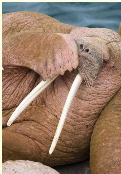
In Spitzbergen gibt es viele Walross-Kolonien

Hinweis für Expeditionsreisen: Auf den Reisen geben die Elemente den Ton an: Wetter, Wind und Eis bestimmen am Ende den Ablauf. Da Sicherheit oberste Priorität hat, richtet der Kapitän die Reiseroute nach den Gegebenheiten. Deshalb kann die angegebene Route nur eine Vorstellung vermitteln – jede Expedition mit Hurtigruten ist einzigartig.