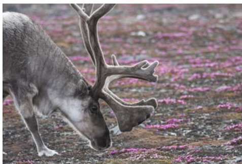
... und vielleicht auch Rentiere