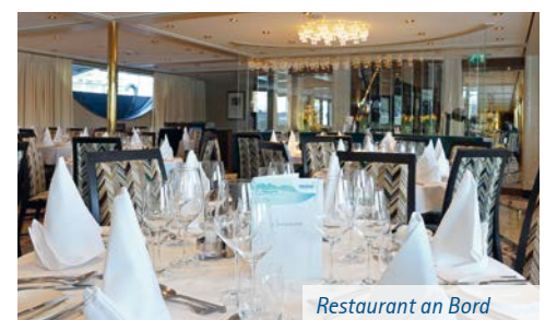
Restaurant an Bord