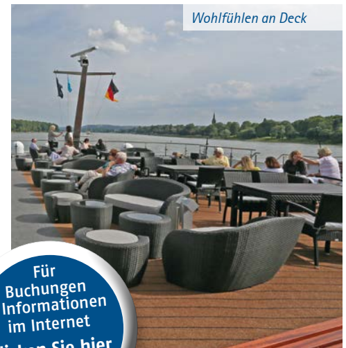
Wohlfühlen an Deck