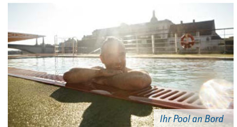
Ihr Pool an Bord

Trinkgelder: Die Crew macht ihren Job mit ganzer Leidenschaft und möchte jedem Gast einen unvergesslichen Urlaub bereiten. Wenn Sie zufrieden sind, freuen sich die Mitarbeiter über ein Trinkgeld als Anerkennung. Die meisten Gäste honorieren das Bemühen mit € 5 bis € 10 pro Gast und Tag. Eine Trinkgeld-Box für die gesamte Crew steht am Ende der Reise an der Rezeption bereit. Selbstverständlich können Sie auch jederzeit individuell den Mitarbeitern ein Trinkgeld geben, auch die Abrechnung über das Bordkonto ist möglich.