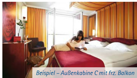
Beispiel – Außenkabine C mit frz. Balkon

Die 86 komfortablen Außenkabinen (Nichtraucher) sind 14,5 m 2 groß und mit Dusche/WC, Telefon, Haartrockner, Safe mit individuell einstellbarem Zahlencode, SAT-TV und einer individuell regulierbaren Klimaanlage ausgestattet. Sie verfügen größtenteils über einen französischen Balkon. Die Fenster können nur in der Kategorie 2-Bett-Außenkabine C und D mit französischem Balkon geöffnet werden. Die Schiffe verfügen in der Kategorie S über Kabinen mit getrennten Betten und Zusatzbett.