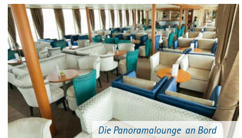
Die Panoramalounge an Bord