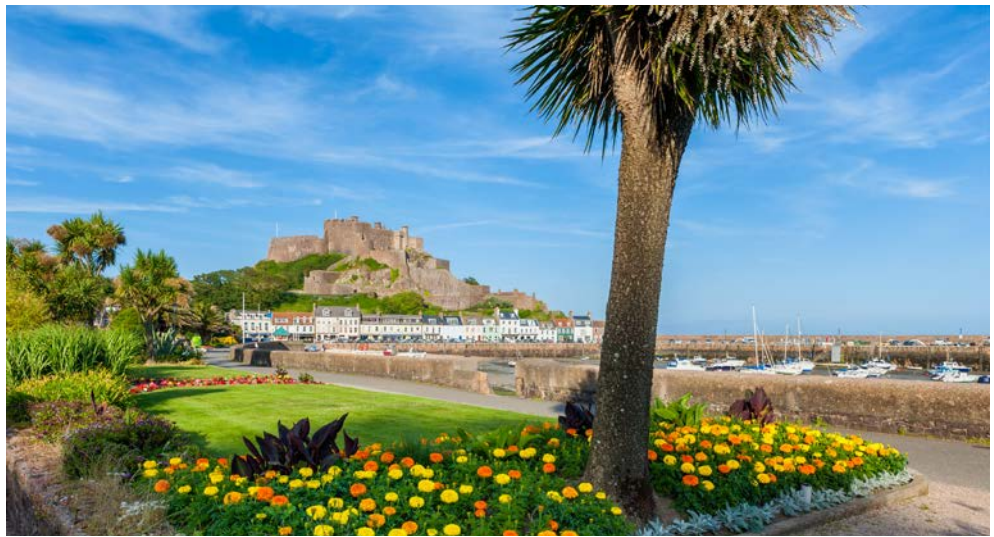
Mont Orgueil Castle (oder Gorey Castle, weil es oberhalb des Dorfes Gorey liegt)

Der Wind streicht über das Gesicht, die Luft riecht nach Salz. Mächtige Gezeitenströme lassen Sandstrände kommen und gehen. Hinter Buchsbaumhecken und Vorgärten, in denen Hortensien, Kamelien und Rosen blühen, verbergen sich altherwürdige viktorianische oder Tudor-Herrenhäuser. Ja, Sie sind auf den Kanalinseln! Im Ärmelkanal näher an Frankreich als am Mutterland England gelegen, vereinen sie das Beste aus zwei Welten. Britisches Understatement trifft auf französisches Savoir-vivre, man spricht Englisch und speist wie in Frankreich. Einheimische und Besucher sind sich einig: Die Kanalinseln sind très beautiful! Höchste Zeit, den eigenwilligen Schönheiten einen Besuch abzustatten! Auf der Jersey-Standortreise entdecken Sie stolze Burgen, prähistorische Ganggräber und die bezaubernde Hauptstadt St. Helier. Kosten Sie unbedingt die sagenhaft frischen Meeresfrüchte mit – „of course“ – Chips, der englischen Pommes-frites-Variante.