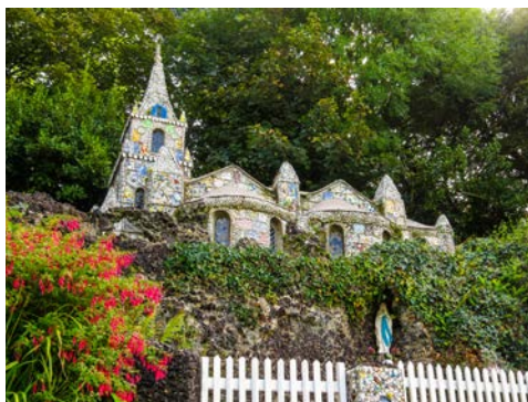
„Little Chapel“ auf Guernsey

Port kennen. Sie zählt zu den schönsten Städten der Kanalinseln. Sie erfahren Näheres zu der reichhaltigen Geschichte der Stadt und spazieren über Kopfsteinpflaster, steile Treppenaufgänge und durch schmale Gassen. Bei einer anschließenden Inselrundfahrt sehen Sie die „Little Chapel“. Diese soll das kleinste offiziell geweihte Gotteshaus der Christenheit sein. Angeregt von der berühmten Grotte von Lourdes bauten fromme Mönche ab 1914 nacheinander mehrere Miniatur-Versionen des Wallfahrtsplatzes in die waldige und hügelige Landschaft von Guernsey. Beim Bau kamen vor allem Muschelschalen sowie Porzellanscherben zum Einsatz. Anschließend erreichen Sie den Pleinmont Point. Von hier aus haben Sie herrliche Ausblicke auf die Südwestküste, sehen den Hanois Leuchtturm und die Nachbarinsel Jersey. Bei gutem Wetter können Sie sogar die französische Küste sehen. Auf dem Rückweg machen Sie eine Fotopause am Fort Grey an der Westküste. Das kleine Fort wurde 1804 als Verteidigungsfeste errichtet. Am Nachmittag erfolgt die Rückfahrt mit der Fähre nach Jersey.