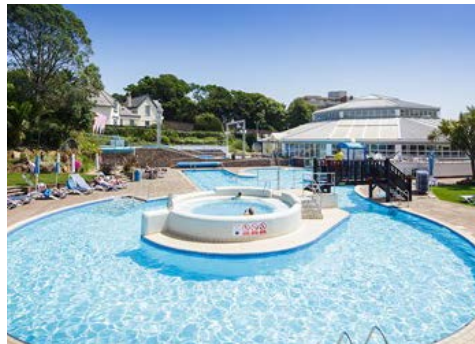
Aussenpool mit Whirlpool