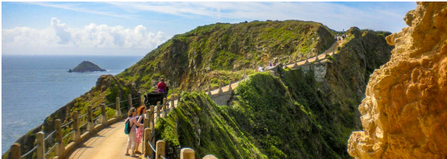
Eine Klippenwanderung auf Sark bietet tolle Ausblicke

Fortbewegungsmittel auf der Insel sind Fahrrad und Pferdekutsche. Mit letzterer erkunden Sie die zweitkleinste Kanalinsel und erleben so das Flair hautnah. Spektakulär ist die schmale Landbrücke zwischen Little Sark und Big Sark: Zu beiden Seiten des Grates geht es 120 Meter steil bis zum Meer hinunter. Aus Sicherheitsgründen müssen die Passagiere der Pferdekutschen vor der Überquerung des Grates aussteigen und zu Fuß hinüberlaufen. Im Anschluss erkunden Sie die üppigen Gärten der La Seigneurie, wo standesgemäß der aktuelle Herrscher von Sark wohnt. Spätnachmittags Rückfahrt mit der Fähre nach Jersey und Transfer zum Hotel.