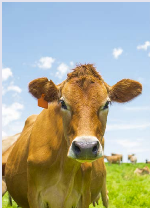
Die „typische“ Jersey-Kuh

Nicht entgehen lassen sollten Sie sich den Zusatzausflug nach Sark – der letzte Feudalstaat Europas. Per Fähre setzen Sie von Jersey über. Seit dem 16. Jahrhundert wird die Insel in Erbfolge von einem „Seigneur“ regiert. Schon am Hafen fühlt man sich ins vorige Jahrhundert zurückversetzt: